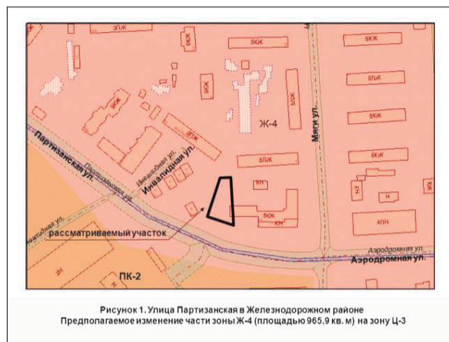
Рисунок 1. Улица Партизанская в Железнодорожном районе Предполагаемое изменение части зоны Ж-4 (площадь 965,9 кв. м) на зону Ц-3

Отклоненные предложения о внесении изменений в Правила застройки и землепользования в городе Самаре, утвержденные постановлением Самарской Городской Думы от 26.04.2001 № 61, в части изменения границ территориальных зон