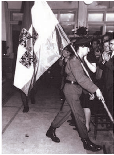
ФОТО → Почетный воинский караул вносит Самарское знамя. Фотография из болгарского альбома. 1966 г.

Один из первых документов той поры - письмо из стара-загорского городского народного совета в Куйбышевский горсовет от 8 ноября 1959 года: «Члены комиссии по вопросам народного просвещения шлют вам свой братский привет! Большой радостью было для нас установление дружеских связей на основе обмена опытом. Мы, граждане города Стара Загора, испытываем особенные чувства любви и признательности к русскому народу, дважды проливавшему кровь за наше освобождение». И резолюция Куйбышевского горсовета: «Рекомендуется завязать переписку для обмена опытом. Кроме того, хорошо бы завязать переписку