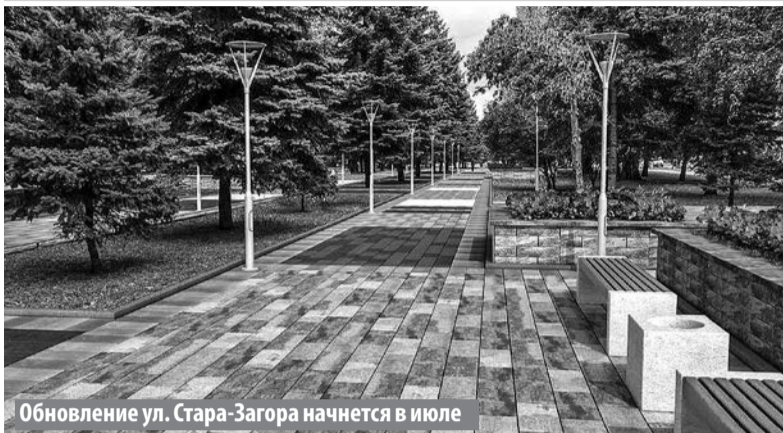
Обновление ул. Стара-Загора начнется в июле

Что изменится в Самаре в течение ближайших лет