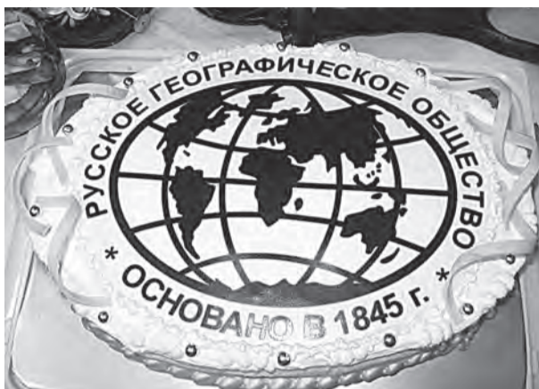
ФОТО → Региональные отделения «Русского географического общества» действуют в каждом из 85 субъектов Российской Федерации.

Купеческий дом на набережной принимает гостей