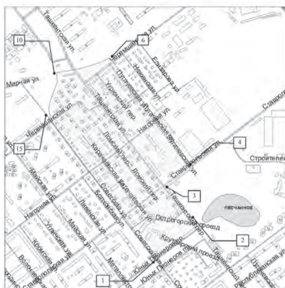
СХЕМА границ территории для подготовки документации по планировке территории в границах улицы Советской, ветки железнодорожных путей, улиц Пугачевской, Ставропольской, переулка Ташкентского, проспекта Юных Пионеров в Кировском районе городского округа Самара