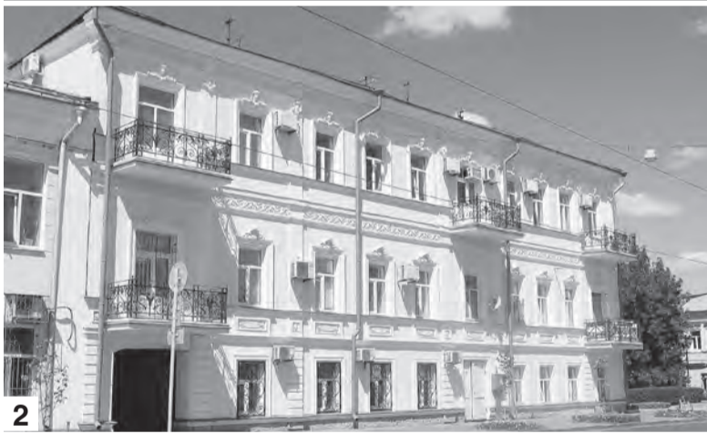
1. Старинные здания на углу улиц Куйбышевской и Льва Толстого - бывшая усадьба купца 2-й гильдии, Почетного гражданина Самары Ивана Львовича Санина. 2. В этом доме на ул. Фрунзе, 120 жил наш земляк - кинорежиссер Эльдар Рязанов, а в позапрошлом веке дом принадлежал разбогатевшему самарцу крестьянского сословия, затем штабс-капитану, врачу, купцу...

Рассказываем о ходе ремонта и об истории зданий