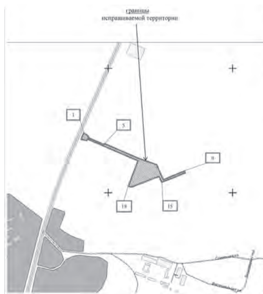
СХЕМА границ территории для подготовки документации по планировке территории (проект планировки территории и проект межевания территории) для размещения линейного объекта транспортной инфраструктуры: «Обустройство подъездных путей, и инженерных коммуникаций в границах кадастрового квартала 63:01:0405003 к коттеджному поселку «Завидово» в Куйбышевском внутригородском районе городского округа Самара