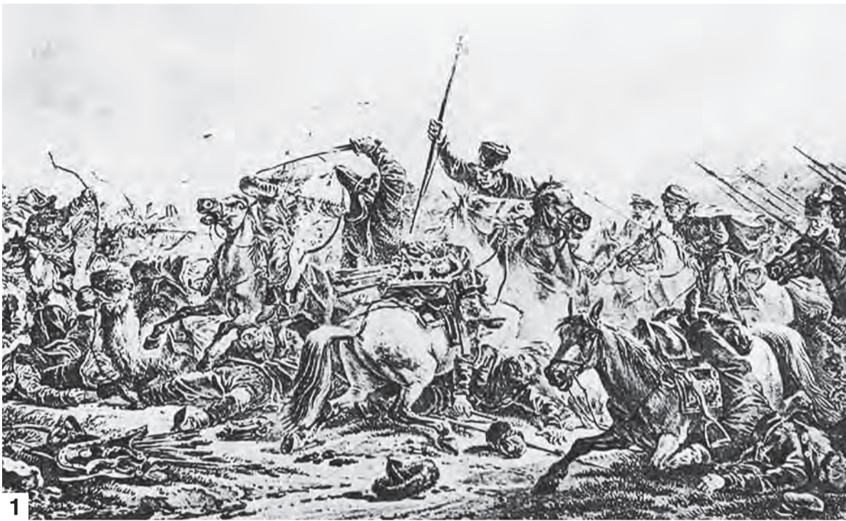
1. Бой казаков с киргизами. 2. Струг XVI - XVII веков.

час, потому что свободы, по сравнению с той эпохой, у нас очень много. Выбор был невелик: крепостная кабала в России и вечное рабство в Орде или бежать с риском для жизни пешком за сотни верст - на Дон или Волгу. На свободу! Свободу тогда ценили. И московские власти понимали это, используя вольных казаков как буфер в отношениях с кочевыми племенами и государствами.