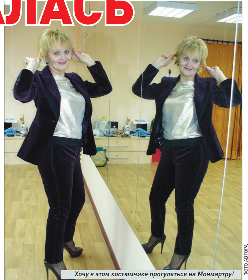
Хочу в этом костюмчике прогуляться на Монмартру!