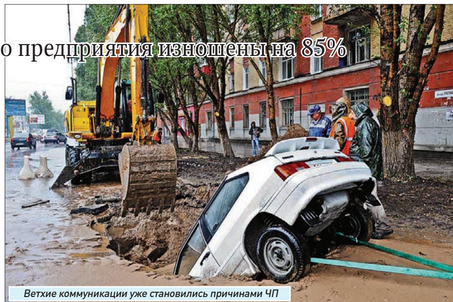
Ветхие коммуникации уже становились причинами ЧП

Согласно расчетам специалистов, модернизация инфраструктуры водоснабжения и канализации Самары потребует 23,7 миллиарда рублей. Таких