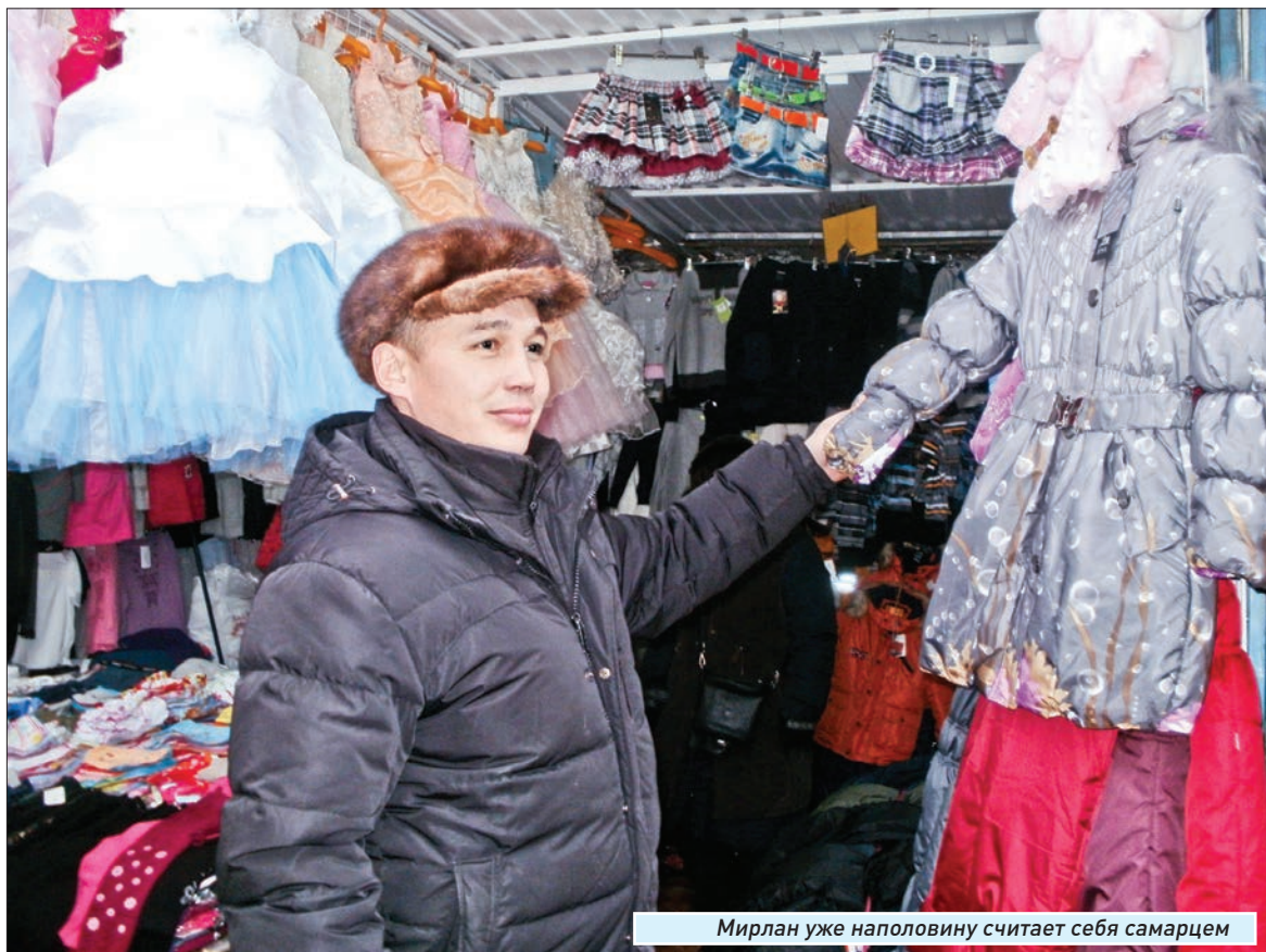
Мирлан уже наполовину считает себя самарцем

Тогда, после распада СССР, с работой было тяжело везде, а