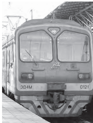
График движения пригородных поездов по маршруту Самара - Жигулевское море - Самара скорректирован. Причина - проведение ремонтных работ на перегоне Старосемейкино - Водинская.

По данным Самарской пригородной пассажирской компании, график изменен на неделю - с 8 по 14 августа. Ознакомиться с новым расписанием можно на сайте компании, в пригородных билетных кассах или по телефону 8-927-745-7457 (с 7.00 до 18.30).