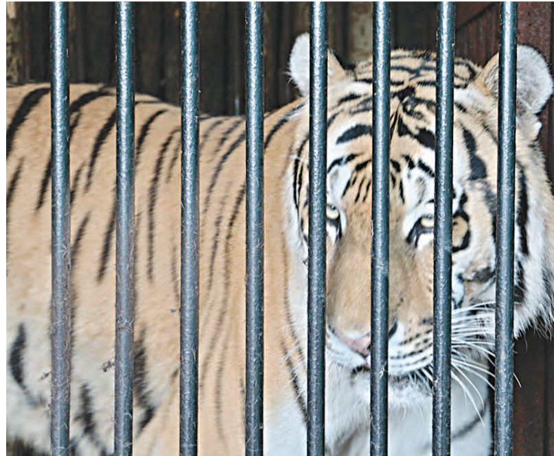
Амурский тигр - один из самых крупных представителей семейства кошачьих. В 30-х годах прошлого столетия вид был на грани исчезновения. К счастью, сейчас популяция этих хищников растет, их насчитывается около 540 особей, но все равно они нуждаются в защите и охране.