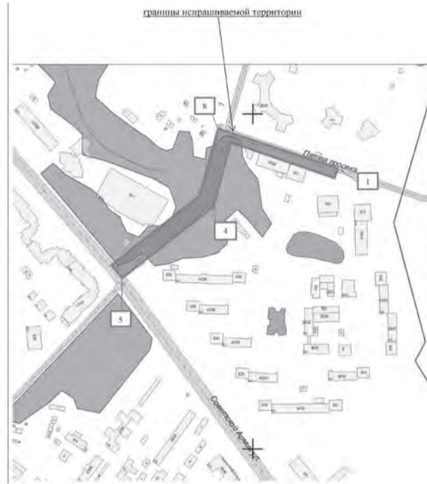
СХЕМА границ территории для подготовки документации по планировке территории (проект планировки и проект межевания) в городском округе Самара в целях размещения линейного объекта «Жилая застройка по адресу: Пятая просека в Октябрьском районе г. Самары. Наружные сети водоснабжения»

ПРИЛОЖЕНИЕ № 1 к распоряжению Департамента градостроительства городского округа Самара 31.10.2016 г. №РД-1007