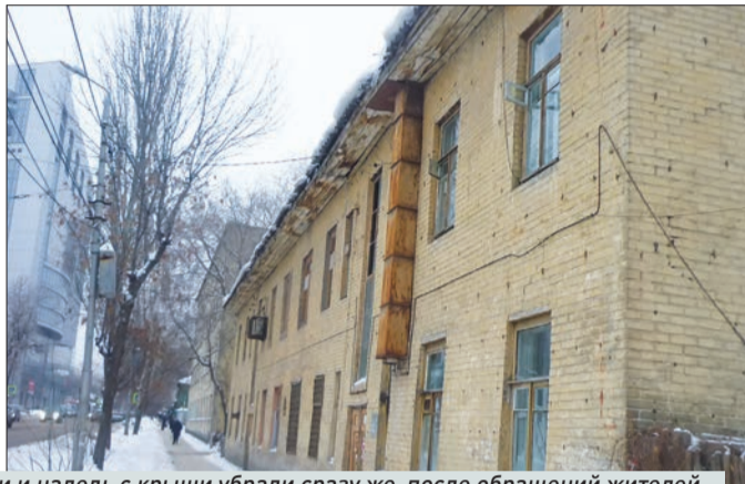
Ул. Ульяновская, 61. Снег, сосульки и наледь с крыши убрали сразу же после обращений жителей