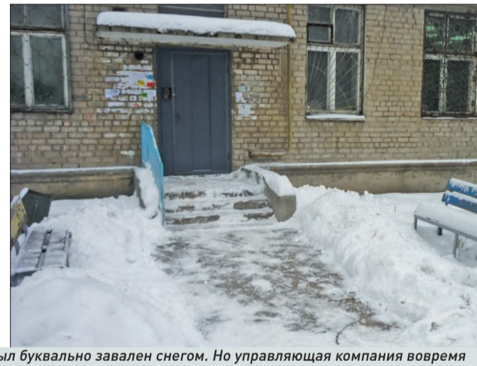
Ул. Спортивная, 29. После метели этот двор был буквально завален снегом. Но управляющая компания вовремя направила сюда дворников и спецтехнику