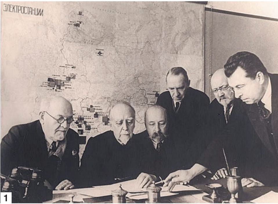
1. Глеб Максимилианович Кржижановский в составе комиссии по разработке плана ГОЭЛРО. 2. Самара. Заготовка дров. 1918 год. 3. Строительство Безымянской ТЭЦ в Куйбышеве.

Продолжаем рассказ о городских тепло- и энергостанциях