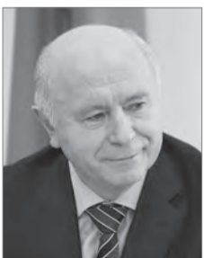
Николай Меркушкин, ГУБЕРНАТОР САМАРСКОЙ ОБЛАСТИ:

Завершилось торжественное мероприятие концертом.