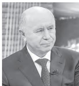
Николай Иванович Меркушкин,

Наша губерния получила 81,7 балла из 100 возможных. Среди плюсов отмечены транспортная инфраструктура (современный аэропорт и железнодорожный вокзал), хорошая организация работы с инвесторами, большое число площадок для организации производства.