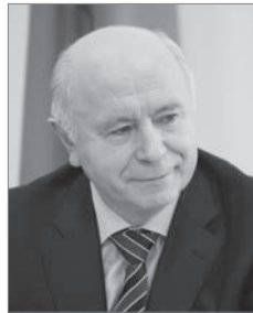
Николай Меркушкин, ГУБЕРНАТОР САМАРСКОЙ ОБЛАСТИ: