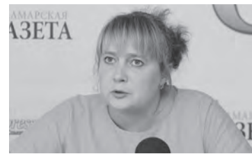
Наталья Данилова, ЗАМЕСТИТЕЛЬ РУКОВОДИТЕЛЯ ДЕПАРТАМЕНТА ФИНАНСОВ И ЭКОНОМИЧЕСКОГО РАЗВИТИЯ АДМИНИСТРАЦИИ САМАРЫ