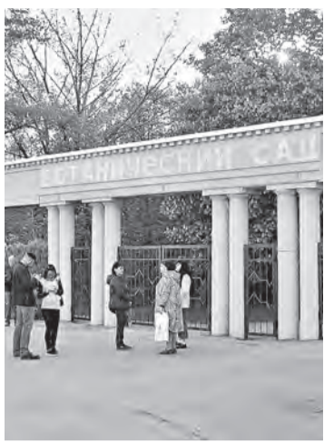
Рекреационная зона будет недоступна для посетителей со следующего понедельника.