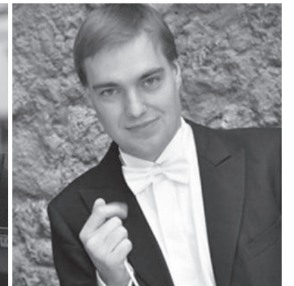
Главный дирижер Евгений Хохлов.