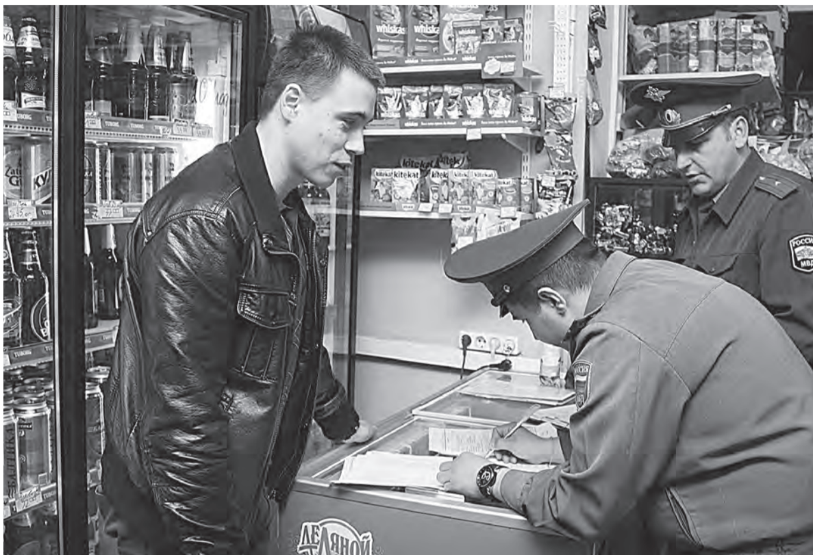
Власти, полиция и общественники усилили борьбу с незаконной торговлей алкоголем