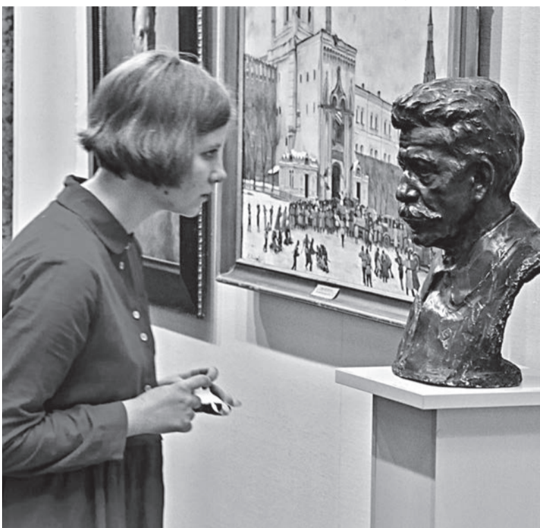
Выставка «Грани XX века. Сто лет российской революции» (0+) продлится в Самарском областном художественном музее (ул. Куйбышева, 92, Мраморный зал) до 20 ноября.

В новой экспозиции художественного музея нет никакой политики, только искусство