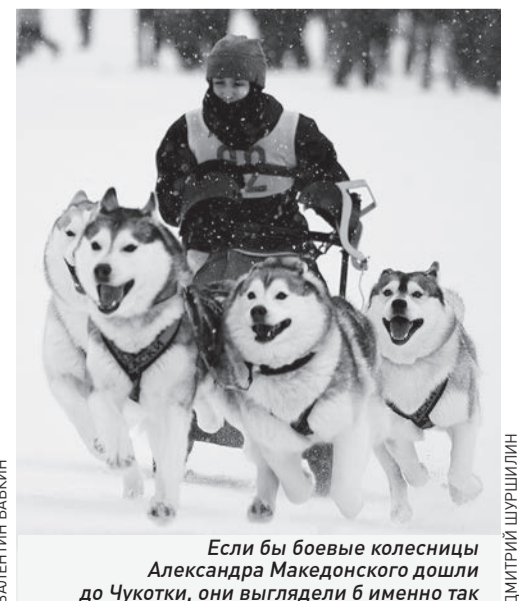
Если бы боевые колесницы Александра Македонского дошли до Чукотки, они выглядели бы именно так