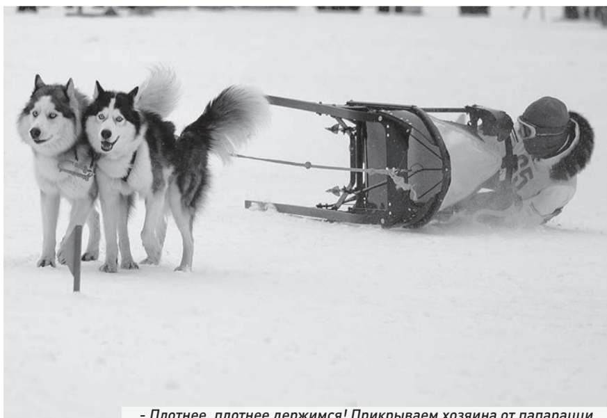
- Плотнее, плотнее держимся! Прикрываем хозяина от папарацци