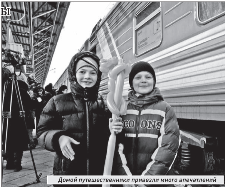
Домой путешественники привезли много впечатлений

«Конечно, дети были на праздниках практически каждый вечер, но главное — мы попали на Кремлевскую елку 7 января, на Рождество. Это было просто чудом. Такое запоминается на всю жизнь. Конечно, дети есть дети: им и пошуметь хочется, и побегать, но мои подопечные вели себя на удивление дисциплини-