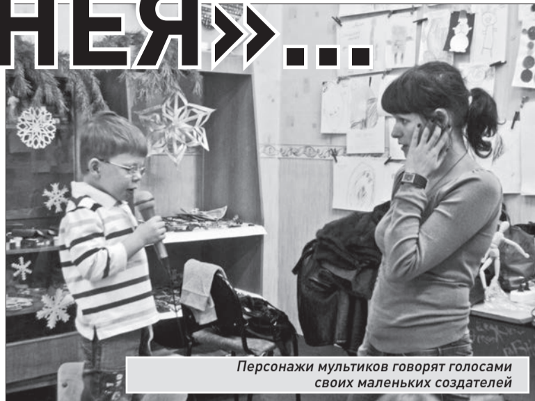
Персонажи мультфильмов говорят голосами своих маленьких создателей

— В 2009 году я случайно увидела анонс фестиваля «Жар-птица», который проводится в Новосибирске уже много лет, — создатель