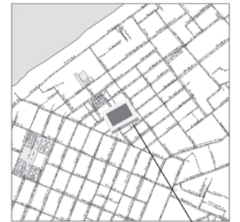
границы испрашиваемой территории