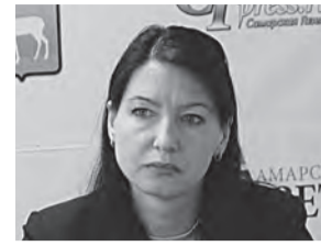
Лариса Манахова, ГЛАВНЫЙ ГОСУДАРСТВЕННЫЙ ИНСПЕКТОР ТРУДА ГОСУДАРСТВЕННОЙ ИНСПЕКЦИИ ТРУДА В САМАРСКОЙ ОБЛАСТИ