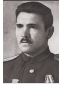
Петр Потапов, Герой Советского Союза