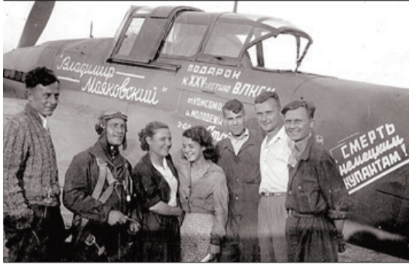
Фронтальная комсомольская бригада и военный летчик на фоне штурмовика Ил-2

Более 70 тысяч комсомольцев Куйбышевской области ушли на фронт. Тысячи ушли добровольца-