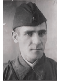
Иван Булкин, Герой Советского Союза