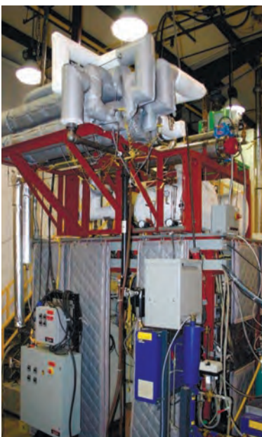
Термохимический аккумулятор, установленный в одном из филиалов ПАО «Кузнецов».