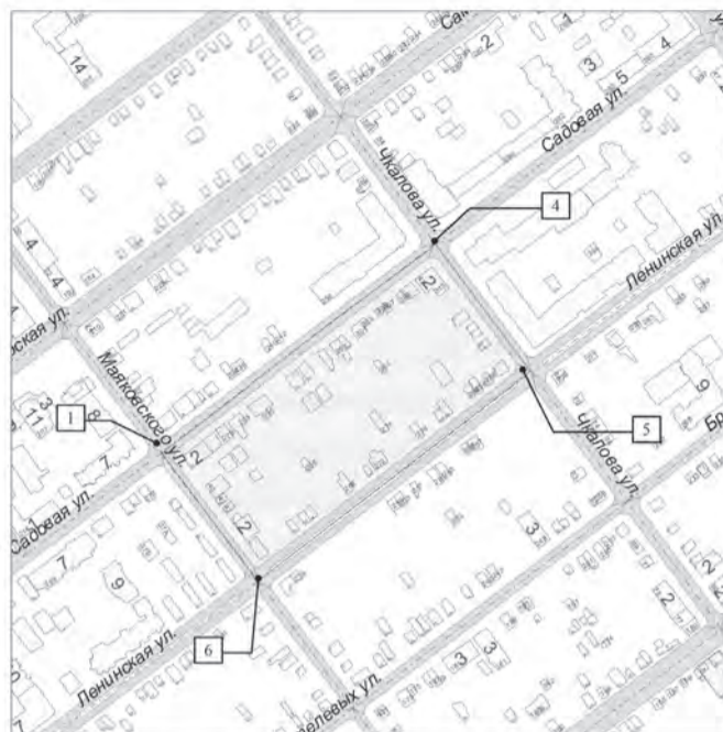
СХЕМА границ территории для подготовки документации по планировке территории (проект межевания территории) в границах улиц Садовой, Чкалова, Ленинской, Маяковского в Ленинском районе городского округа Самара

ПРИМЕЧАНИЕ: 1. Графический материал действителен только для определения границ разработки документации по планировке территории.