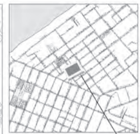
границы испрашиваемой территории