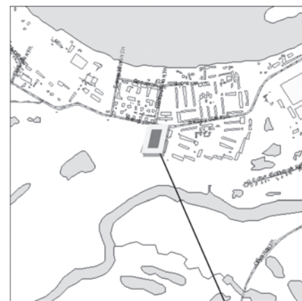
границы испрашиваемой территории