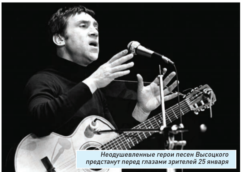
Неодушевленные герои песен Высоцкого предстанут перед глазами зрителей 25 января