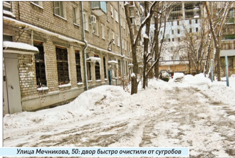
Улица Мечникова, 50: двор быстро очистили от сугробов