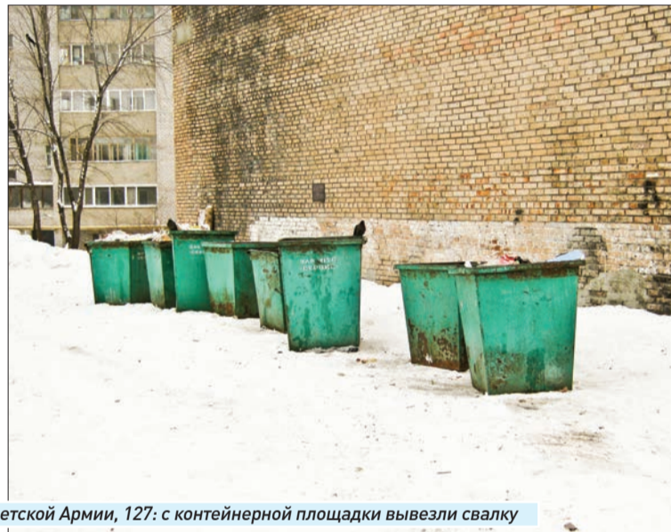
Улица Советской Армии, 127: с контейнерной площадки вывезли свалку