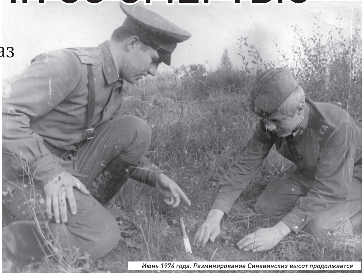
Июнь 1974 года. Разминирование Синявинских высот продолжается

Ежедневно работы саперов начинались с инструктажа по технике безопасности.