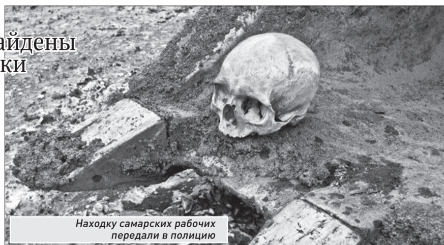
Находку самарских рабочих передали в полицию