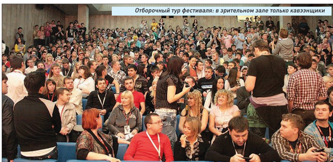
Отборочный тур фестиваля: в зрительном зале только кавээнщики