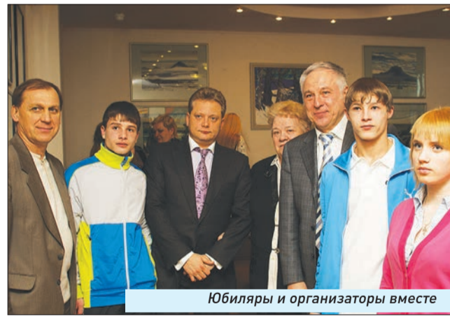
Юбилеры и организаторы вместе

Выставка «Рождение жизни» будет работать в банке до весны 2012 года.