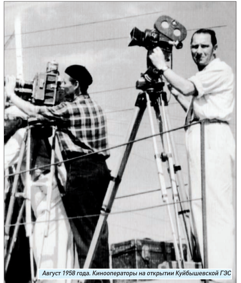
Август 1958 года. Кинооператоры на открытии Куйбышевской ГЭС

Хочу от всей души поздравить ветеранов Самарской студии кинохроники с 85-летним юбилеем. Наша студия – старейшая в России. Поэтому созданные вами документальные ленты стали неотъемлемой частью бесценного национального достояния. Хотелось бы выразить признательность всем кинематографистам за их веру в будущее отечественного кино. Позвольте пожелать вам, дорогие коллеги, здоровья, счастья, новых творческих успехов! Пусть кинолетопись, которую неустанно продолжает Самарская студия кинохроники, пополняется новыми яркими работами, созданными талантливым коллективом профессионалов и единомышленников.