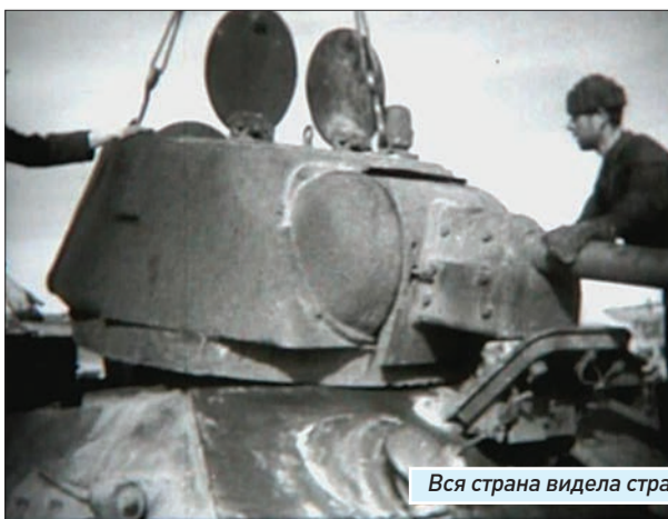
Вся страна видела страшные будни войны, снятые куйбышевскими операторами