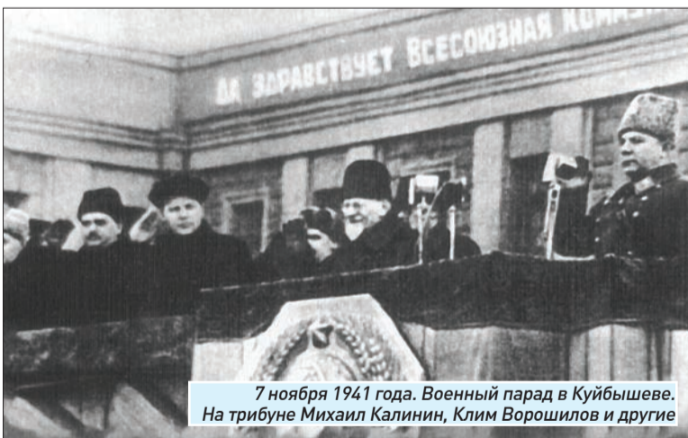
7 ноября 1941 года. Военный парад в Куйбышеве. На трибуне Михаил Калинин, Клим Ворошилов и другие

Нельзя передать словами, что такое документальный кинематограф и кинохроника. Хронос – это же бог времени. И мы поклоняемся ему. Документальное кино называют «кино без актера». С одной стороны, это верно. Но с другой... У нас два великих актера. Всего два, но переиграть их невозможно. Это жизнь и время.