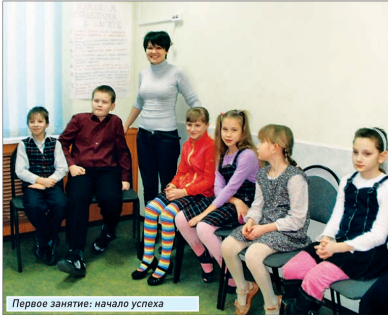
Первое занятие: начало успеха