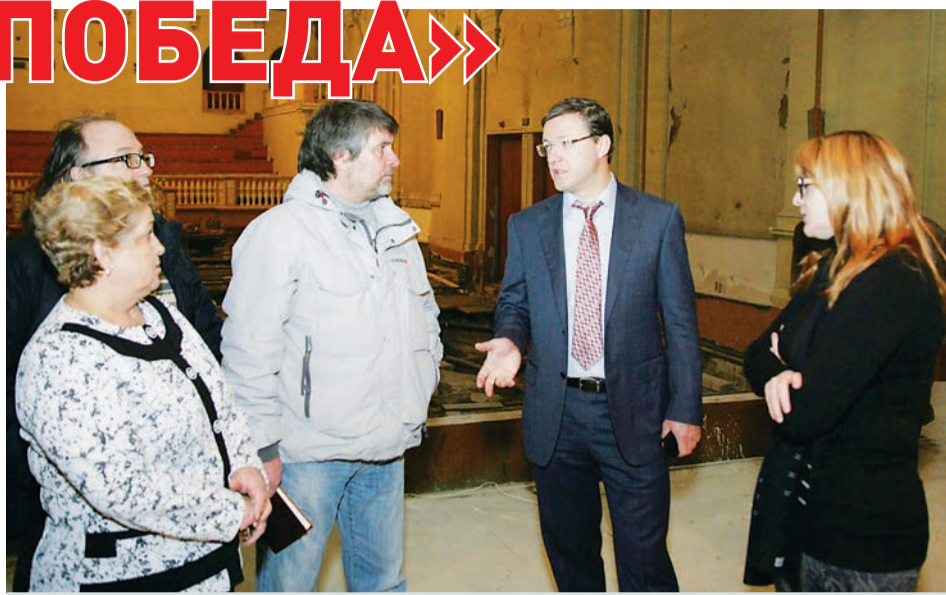
Глава Самары Дмитрий Азаров оценил ремонт в доме культуры «Заря»

В гимназии «Перспектива» мэр встретился с активными жителями Советского района. Сейчас людей особенно волнует информация по дальнейшей оплате коммунальных услуг. Особенно это касается некоторых домов, где установлены приборы учета. Мэр дал поручение