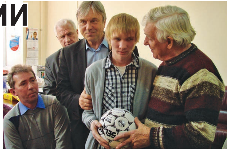
Ветераны «Крыльев Советов» пришли поддержать футболистов-инвалидов

уже взяли на заметку тренеры дубля «Крыльев Советов». И можно только восхищаться теми молодыми людьми, которые, несмотря на серьезные проблемы со зрением, не сдаются и продолжают вести активную жизнь. Я как педагог и как футболист в восторге от ребят из специализированной самарской школы-интерната №17. В Адлере на Президентском кубке они добились отличного результата, заняв высокое четвертое место.