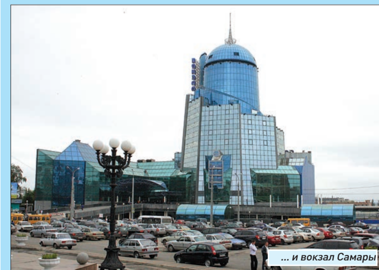
... и вокзал Самары

В других случаях рядом с нынешним названием я бы ставил название старинное и на этом все переименование закончил, то есть общелся бы небольшими деньгами. А на будущее я бы советовал всем быть аккуратнее с названиями, потому как звук, звучание остается на века и еще долго тревожит тени далеких предков.