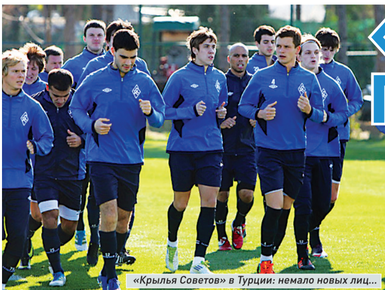
«Крылья Советов» в Турции: немало новых лиц...