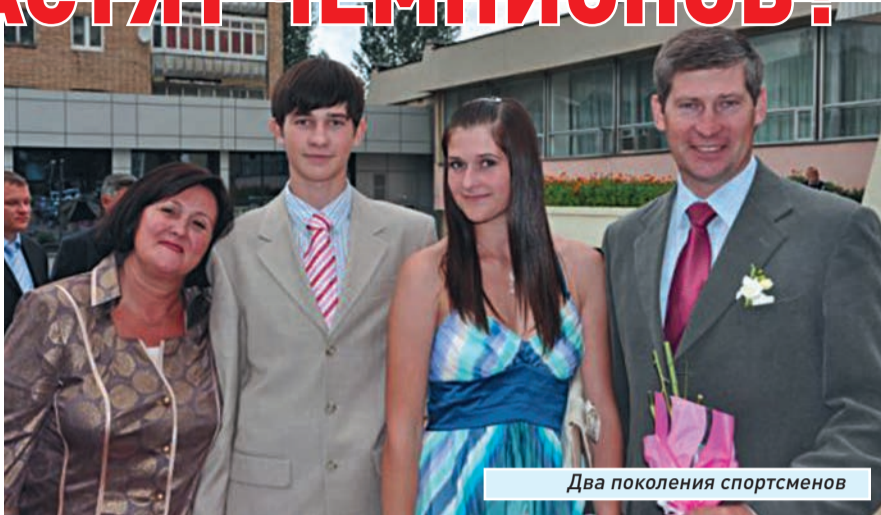
Два поколения спортсменов