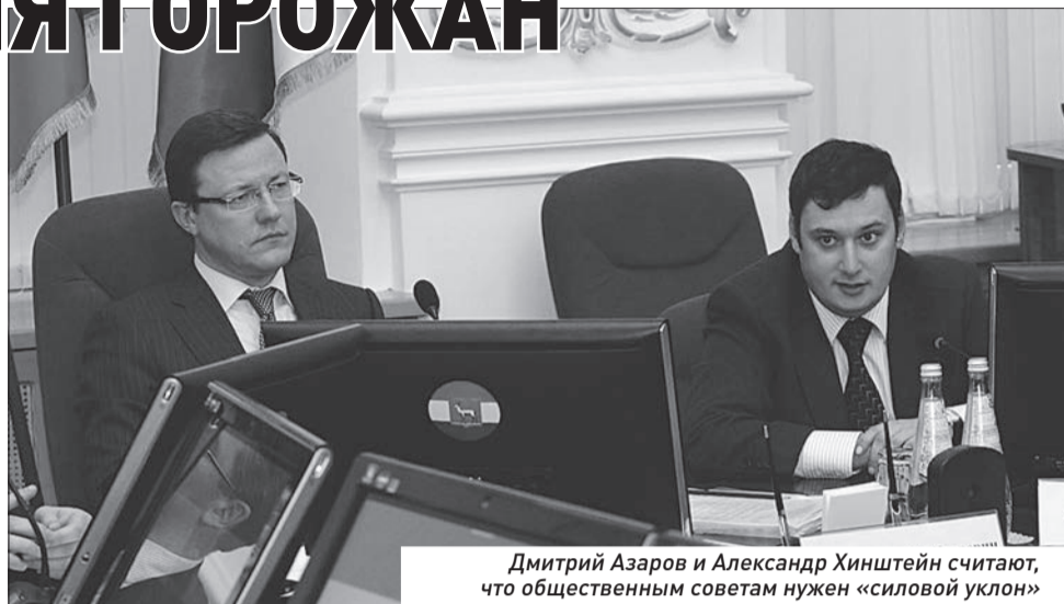
Дмитрий Азаров и Александр Хинштейн считают, что общественным советам нужен «силовой уклон»

пообещал, что муниципалитет предоставит помещения для проведения встреч — в школах, районных администрациях. «Мы поможем и с экспертами», — заверил Дмитрий Азаров . — Активность горожан