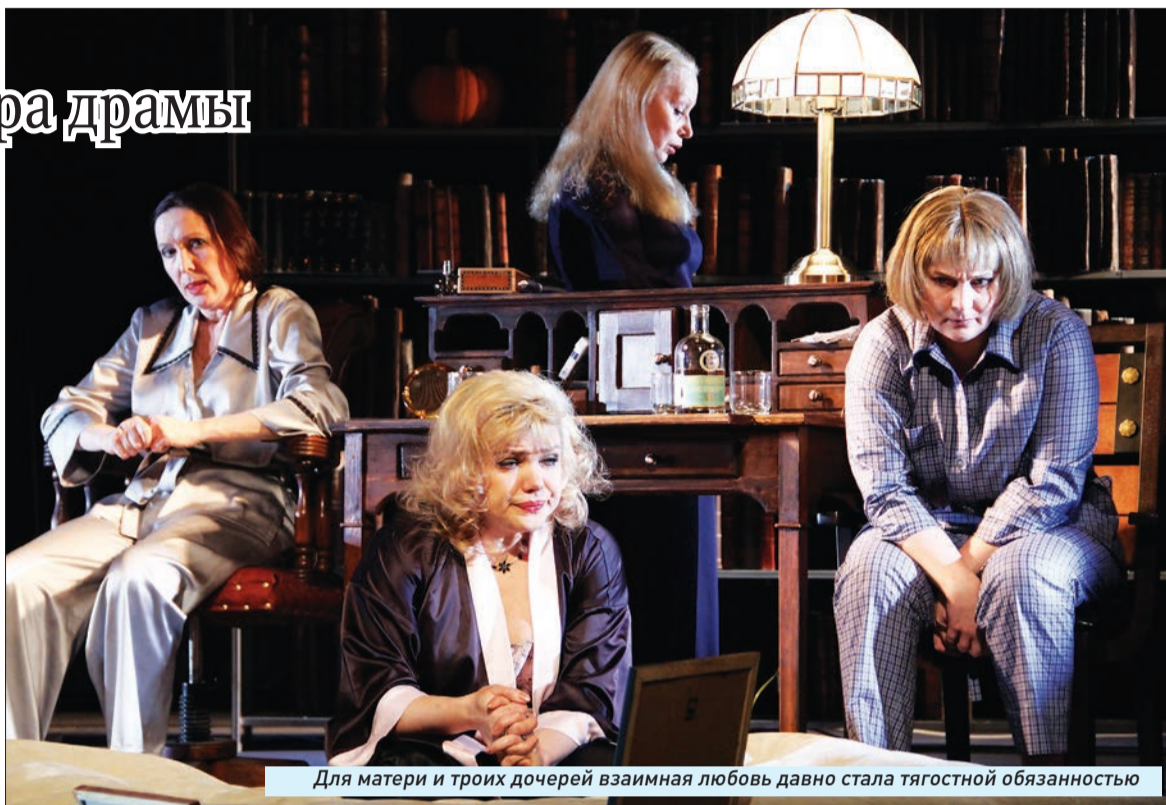
Для матери и троих дочерей взаимная любовь давно стала тягостной обязанностью