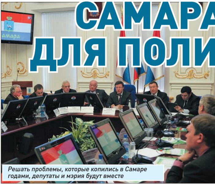
Решать проблемы, которые копились в Самаре годами, депутаты и мэрия будут вместе