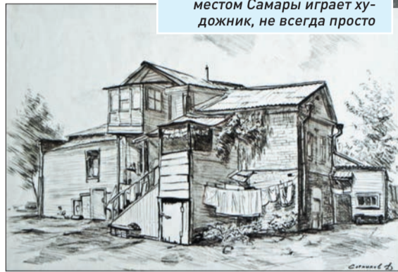
Понять, с каким знаковым местом Самары играет художник, не всегда просто