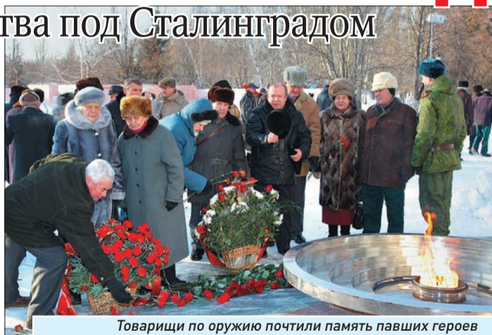
Товарищи по оружию почтили память павших героев

- Я горжусь тем, что был там. Самый тяжелый момент - это когда в конце августа город бомбили сотни немецких самолетов. Было страшно. Но оставить рубеж мы не могли. Мы поддерживали тех, кто тогда попал в окружение. Мы изматывали противника, пока