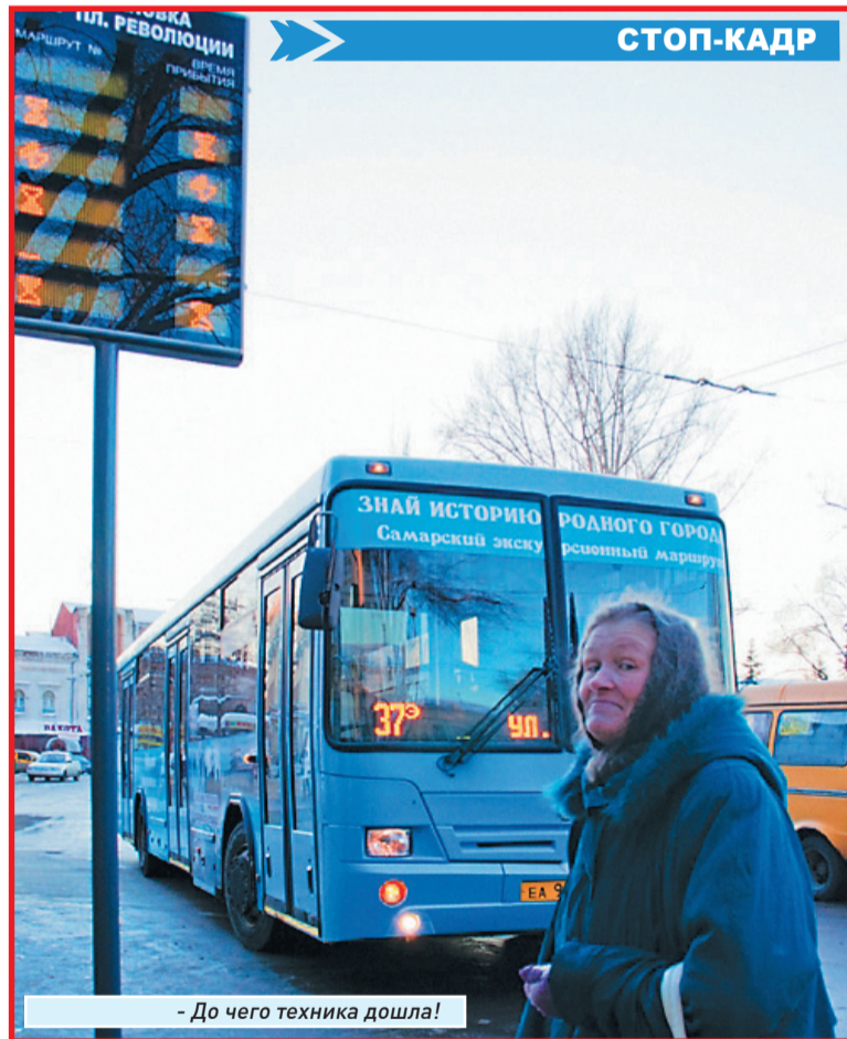
- До чего техника дошла!

Модной прической была «бабетта», как у главной героини индийского фильма «Ритмы песен». Нарядившись, они отправлялись в парк Дома культуры «Родина», в котором находилась танцпло-