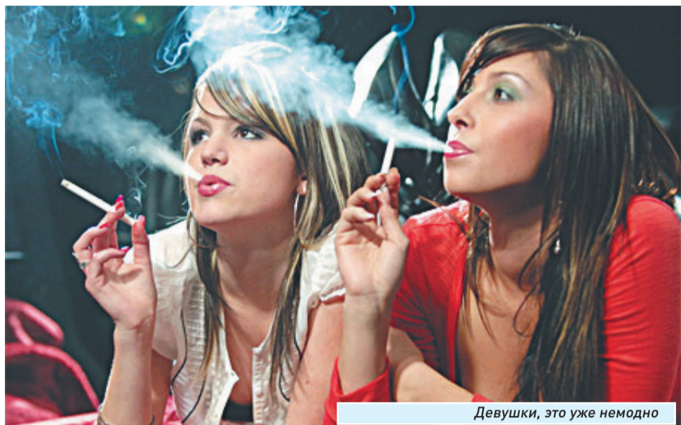
Девушки, это уже немодно

В среднем – по сигарете каждые полчаса. Именно полчаса длится спазм сосудов, а