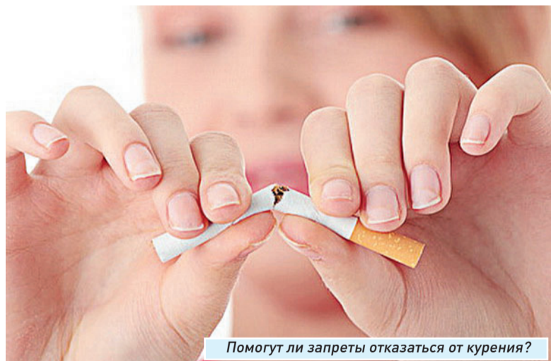
Помогут ли запреты отказаться от курения?