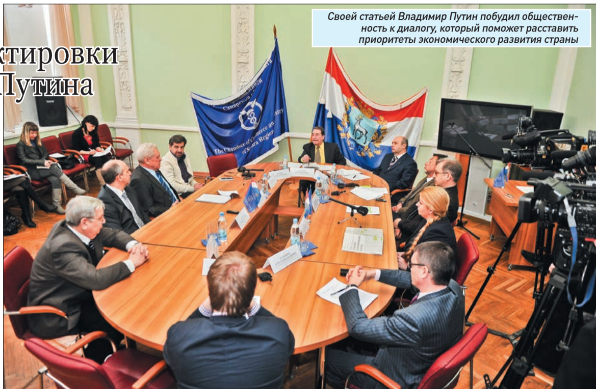
Своей статьей Владимир Путин побудил общественность к диалогу, который поможет расставить приоритеты экономического развития страны

Но чтобы «вызреть», инновациям нужны особые условия