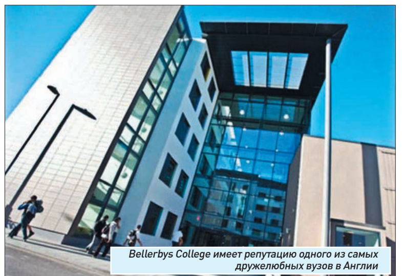
Bellerbys College имеет репутацию одного из самых дружелюбных вузов в Англии