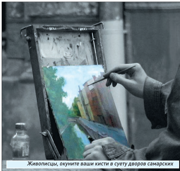
Живописцы, окуните ваши кисти в свету дворов самарских

Среди представителей творческих профессий в нашем регионе нынче, пожалуй, никто так не мается, как художники. Журналисты, актеры и архитекторы худо-бедно при ремесле, писатели и музыканты тоже на виду. Только живописцы со скульпторами творят в своих мастерских кулуарно, вдали от публики. Чаще всего не обладая талантом пристроить сотворенное в приличное место либо в хорошие руки.