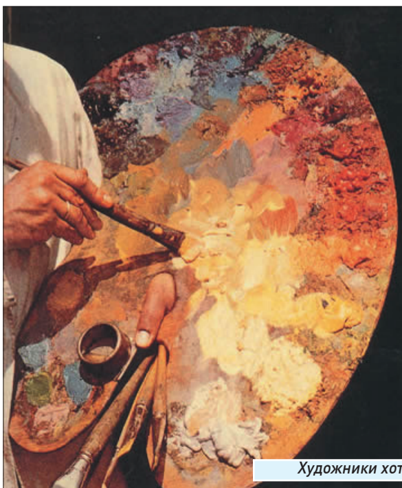
Художники хотят работать с отдачей, а для этого им нужна помощь