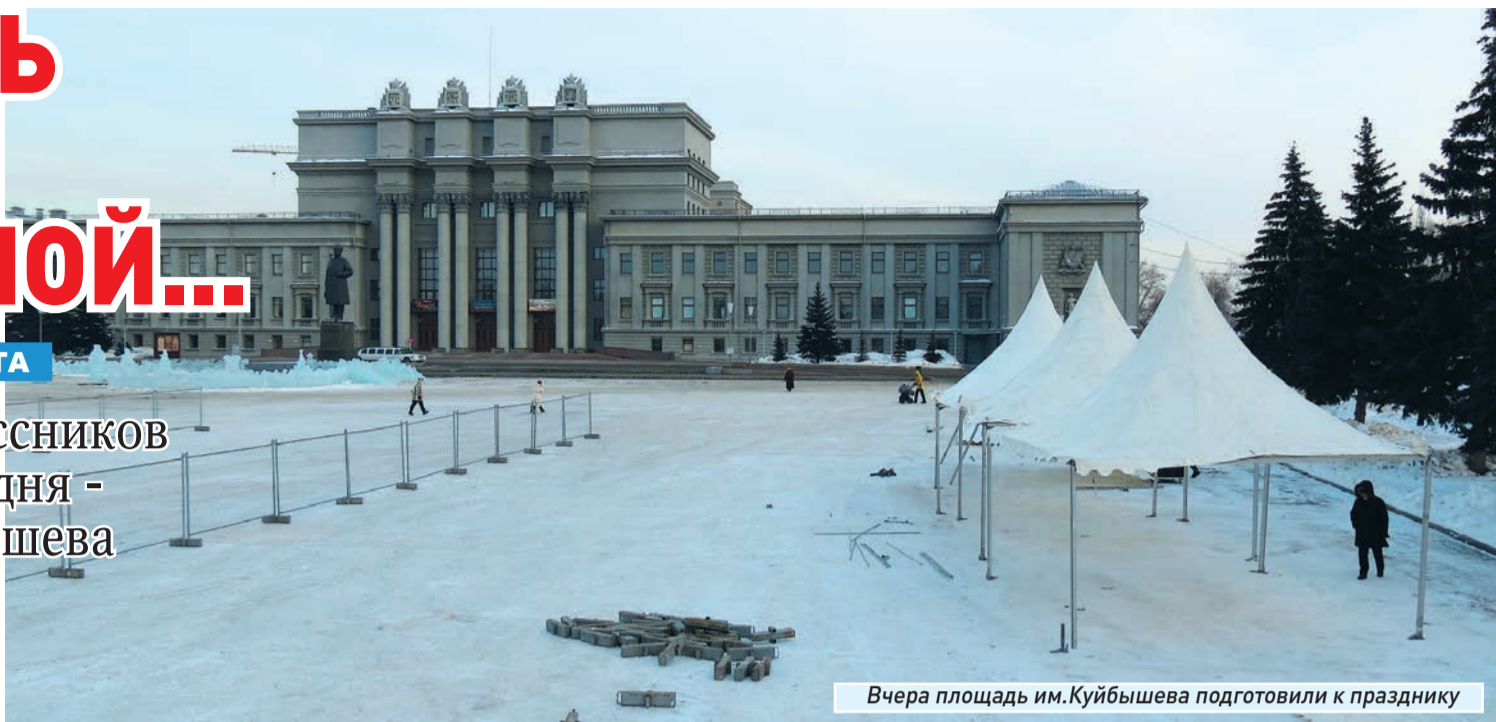
Вчера площадь им. Куйбышева подготовили к празднику

- Самые лучшие друзья - школьные. Они проверены временем. Если у кого-то из нас что-то случается, мы всегда поддерживаем друг друга. Встреча с одноклассниками и