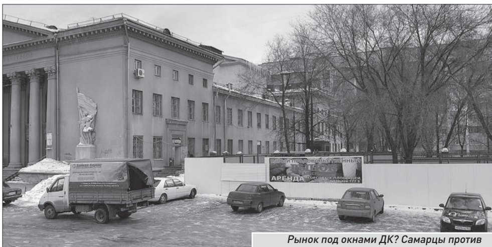
Рынок под окнами ДК? Самарцы против

Предпринимателям дали время на размышление до 10 февраля. В конце недели они должны принять решение о смене места торговли. В противном случае вопрос будет решаться через суд.