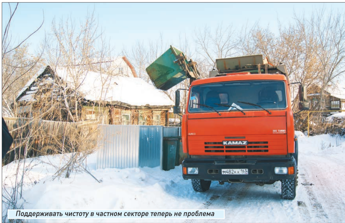
Поддерживать чистоту в частном секторе теперь не проблема