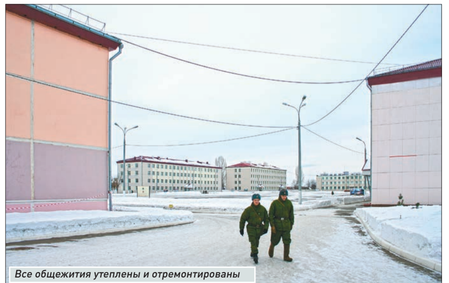
Все общежития утеплены и отремонтированы