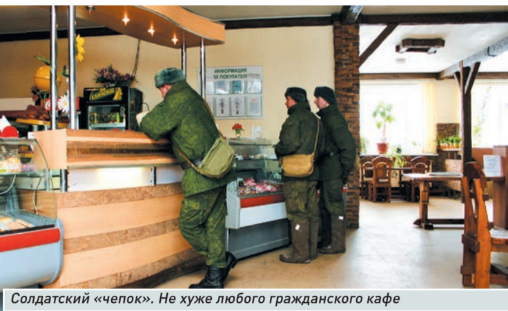
Солдатский «чепок». Не хуже любого гражданского кафе

- Я в Самаре уже девять лет служу. Сначала срочная служба, потом окончил Вольское училище тыла. До 2009-го служил на окружном пищевом складе. Затем военнотруженики заменили на гражданских, и меня перевели в бригаду. На службу не жалуюсь, зарплата устраивает. Особенно теперь. Из Самары уезжать не собираюсь. Да и жена отсюда родом. Она работала в магазине рядом с частью. Сперва я туда за продуктами бегал, а потом за ней (смеется). Сейчас дочери уже два года. В августе очередь в детский сад подойдет. Что ж так не служить? Служи и радуйся! А то, что по телевизору про армию говорят... Что они знают про армию-то?