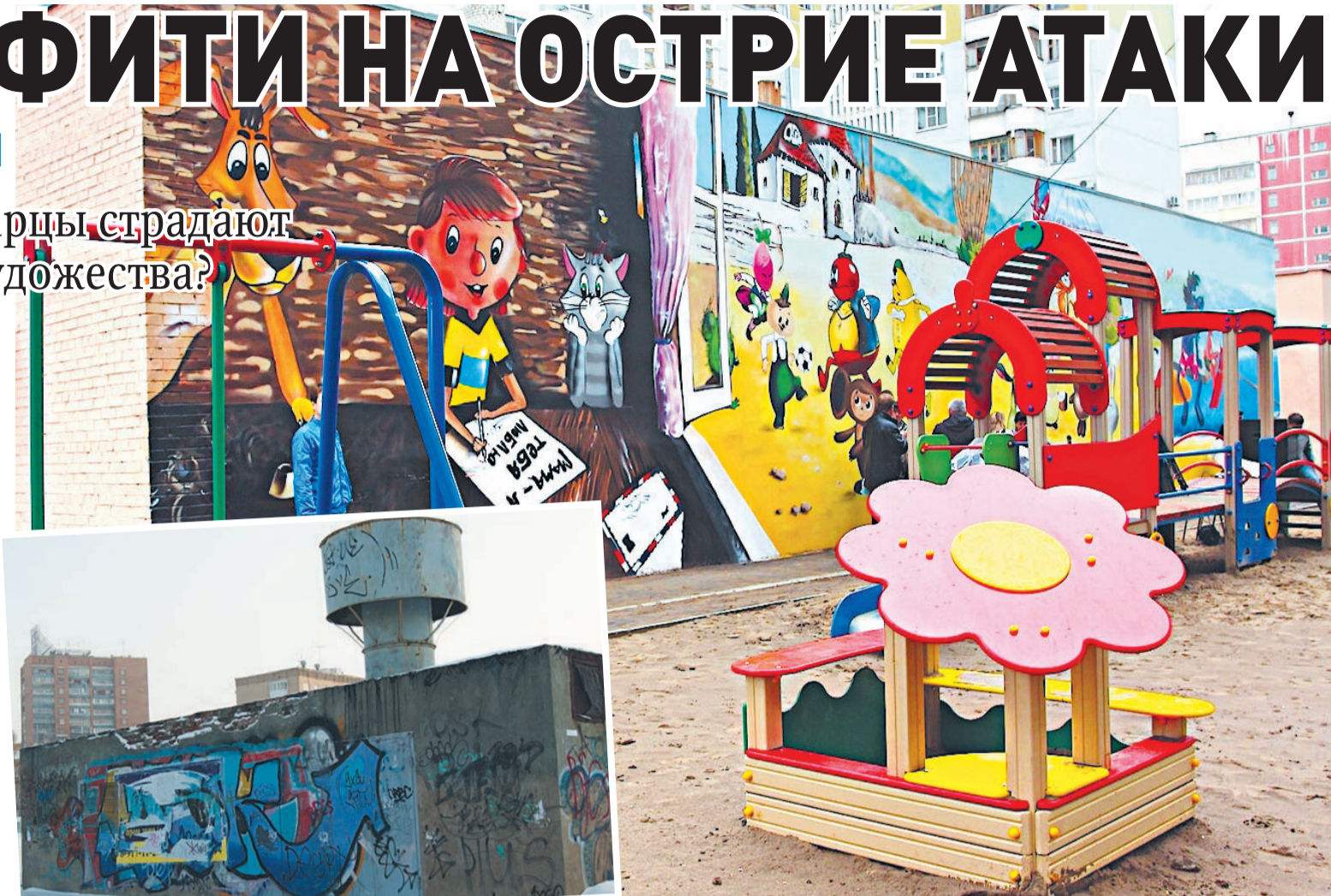
Такие «автографы» только портят вид города (ул. Ново-Садовая, 44а)