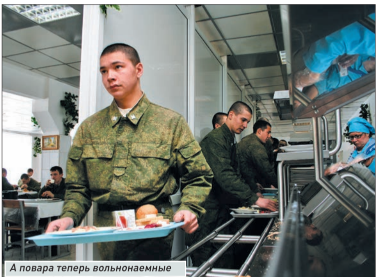
А повара теперь вольнонаемные