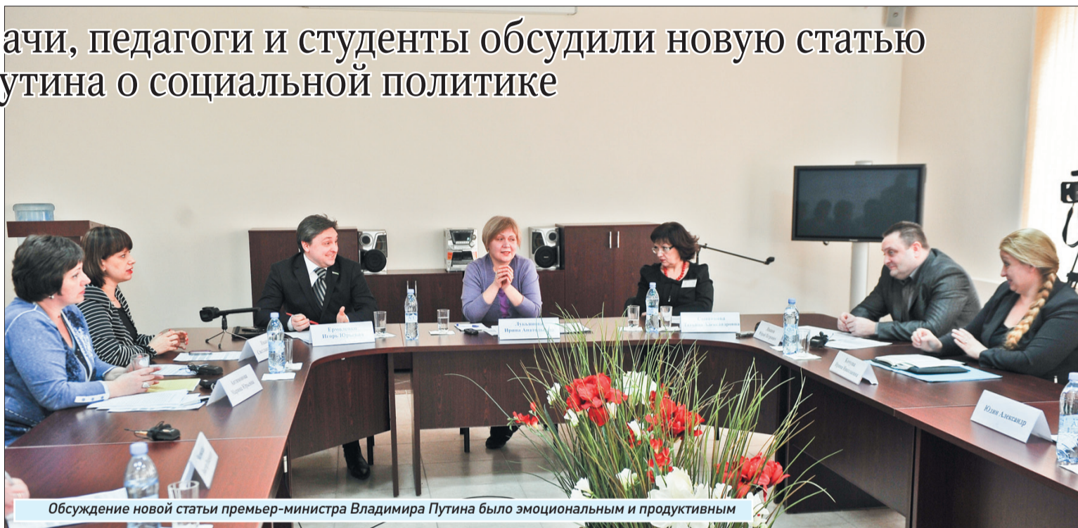
Обсуждение новой статьи премьер-министра Владимира Путина было эмоциональным и продуктивным

В первую очередь эксперты обсудили предложение главы Правительства РФ ввести новое социальное пособие при рождении третьего и последующих детей до достижения ими трехлетнего возраста. «Сегодня размеры большей части пособий на детей, прямо скажем, постыдно малы. Предлагаю в