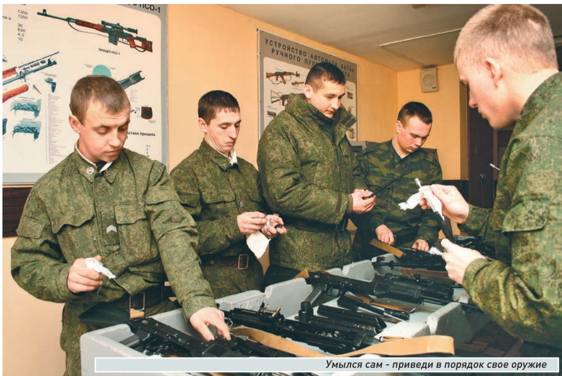
Умылся сам - приведи в порядок свое оружие