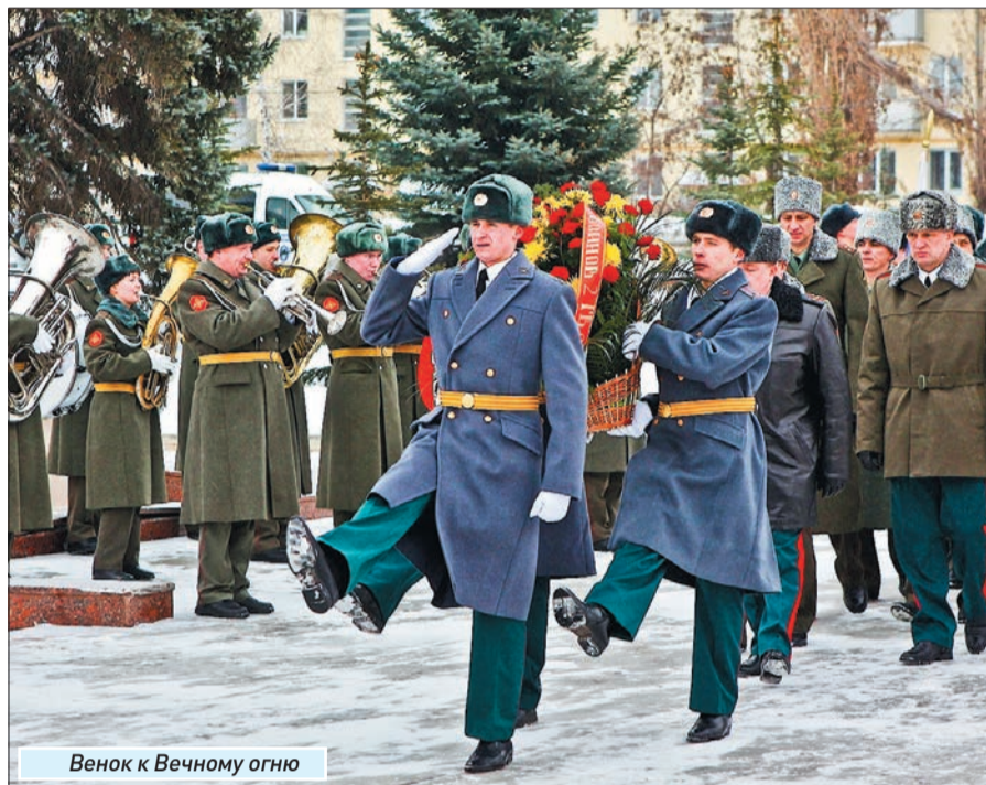
Венок к Вечному огню

Пришедшие выстроились в колонны и под звуки марша двинулись к мемориальному комплексу. Люди подходили к Вечному огню, кланялись, замирали на несколько секунд, военные отдавали честь, кто-то из ветеранов смахивал слезу... Церемония продолжалась около часа. Но даже после ее окончания многие не спешили разойтись по домам, общались со знакомыми, делились воспоминаниями.