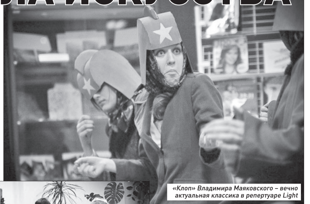
«Клоп» Владимира Маяковского – вечно актуальная классика в репертуаре Light

Мы ставим и классику, и современные пьесы. Например, в нашем репертуаре был