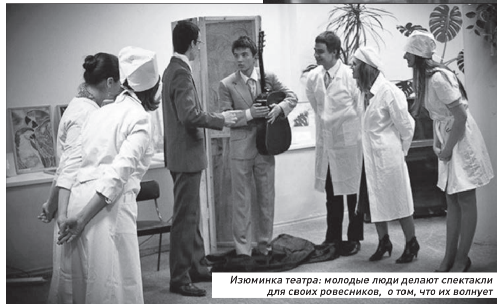
Июминка театра: молодые люди делают спектакли для своих ровесников, о том, что их волнует

Все началось с того, что голландским специалистам пришла в голову идея соз-