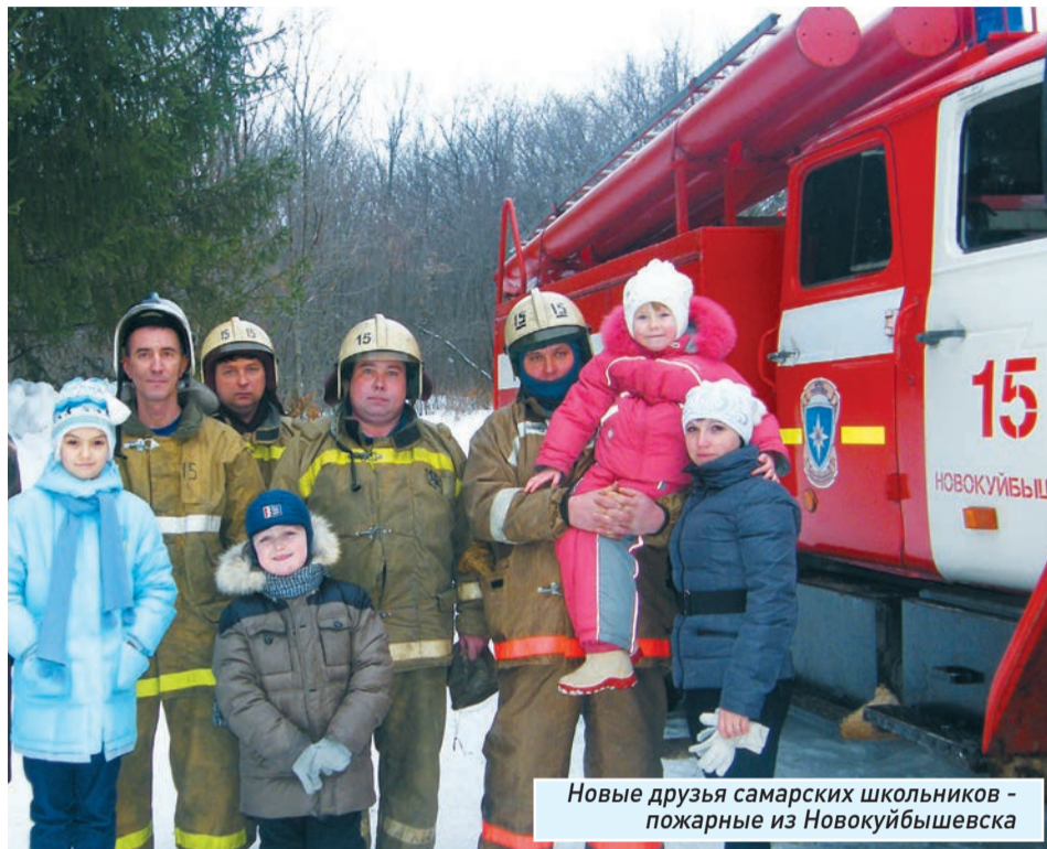
Новые друзья самарских школьников - пожарные из Новокуйбышевска

Впечатления, полученные от этих мероприятий, ребята и родители выра-