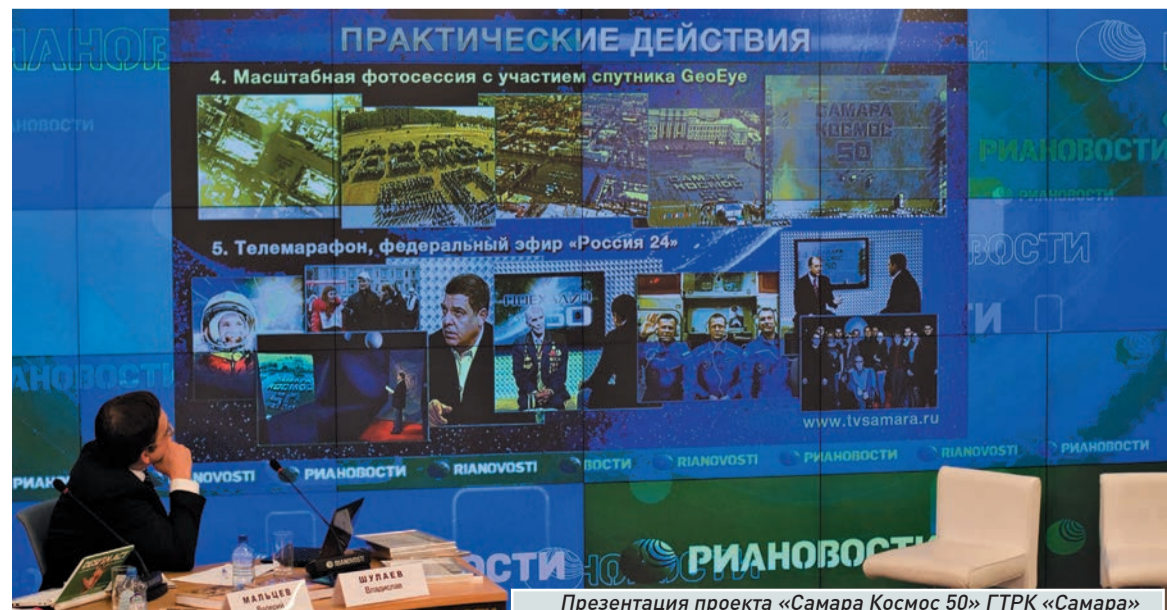
Презентация проекта «Самара Космос 50» ГТРК «Самара»