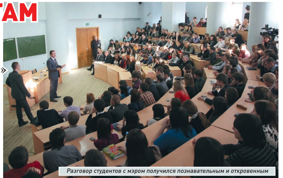
Разговор студентов с мэром получился познавательным и открытым

чиновников, о выборах и веб-камерах на избирательных участках, о трамвае с Wi-Fi и елях у ЦУМа «Самара», о пробках и строительстве станции метро «Алабинская», о КВН и многом другом. Особенно актуален для ребят вопрос утечки мозгов за границу. Дмитрий Азаров стоял перед ребятами и отвечал уверенно, подробно, извинялся за длинные выступления, ведь хочется полно осветить все темы. «Да, есть страны, где жизнь кажется сказкой и туда хочется уехать. Но кто тогда приведет в порядок наш город, нашу страну? Мы готовы поддерживать наших молодых специалистов». При этом мэру удачно шутил, разбавляя серьезные разговоры и вызывая дружный смех и аплодисменты студентов.