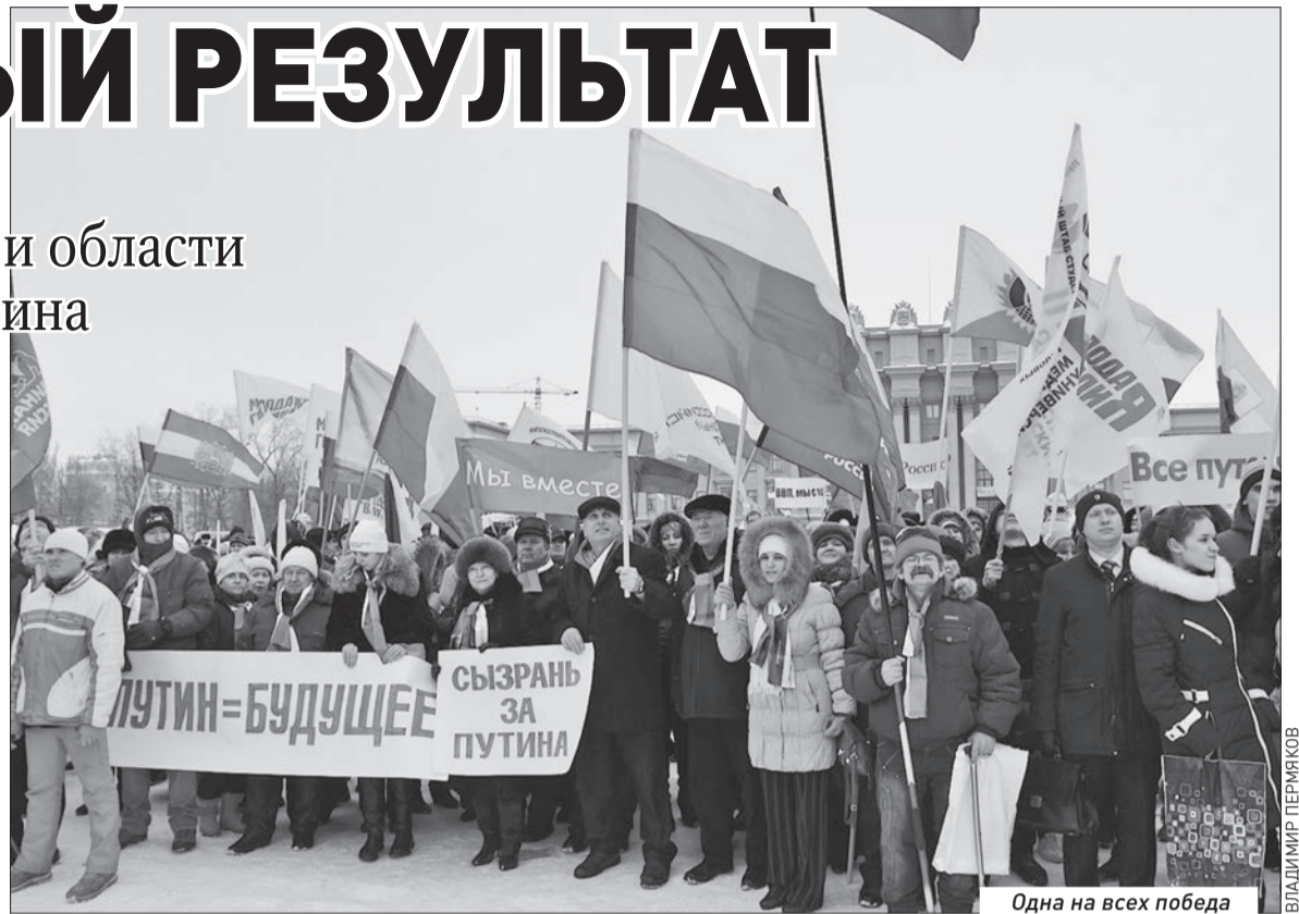
Одна на всех победа

По мнению Александра Хинштейна, успех президентской кампании, в сравнении с декабрьскими депутатскими выборами, объясняется в первую очередь тем, что «личный рейтинг Владимира Путина выше рейтинга партии «Единая Россия». «Еще одна причина в том, что власть, по итогам декабрьских выборов и последовавших за ними обще-