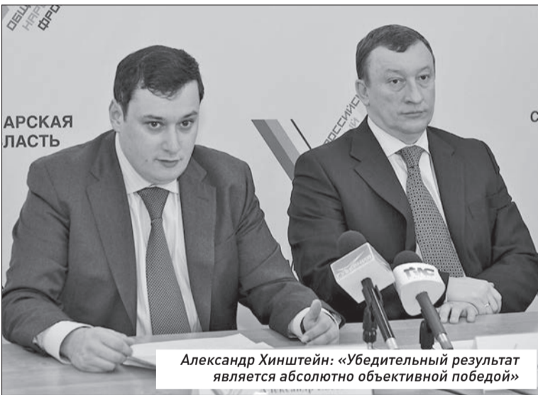
Александр Хинштейн: «Убедительный результат является абсолютно объективной победой»

— Вчера мы сделали выбор, определив будущее страны, — обратился к собравшимся Александр Хинштейн. — В народе говорят: «День год кормит». А тот день, который мы прожили 4 марта, и выбор, который сделали, обеспечит нам стабильную жизнь на шесть лет вперед. Мы победили, будем побеждать и впредь, потому что с берегов Волги в Россию всегда приходила победа».