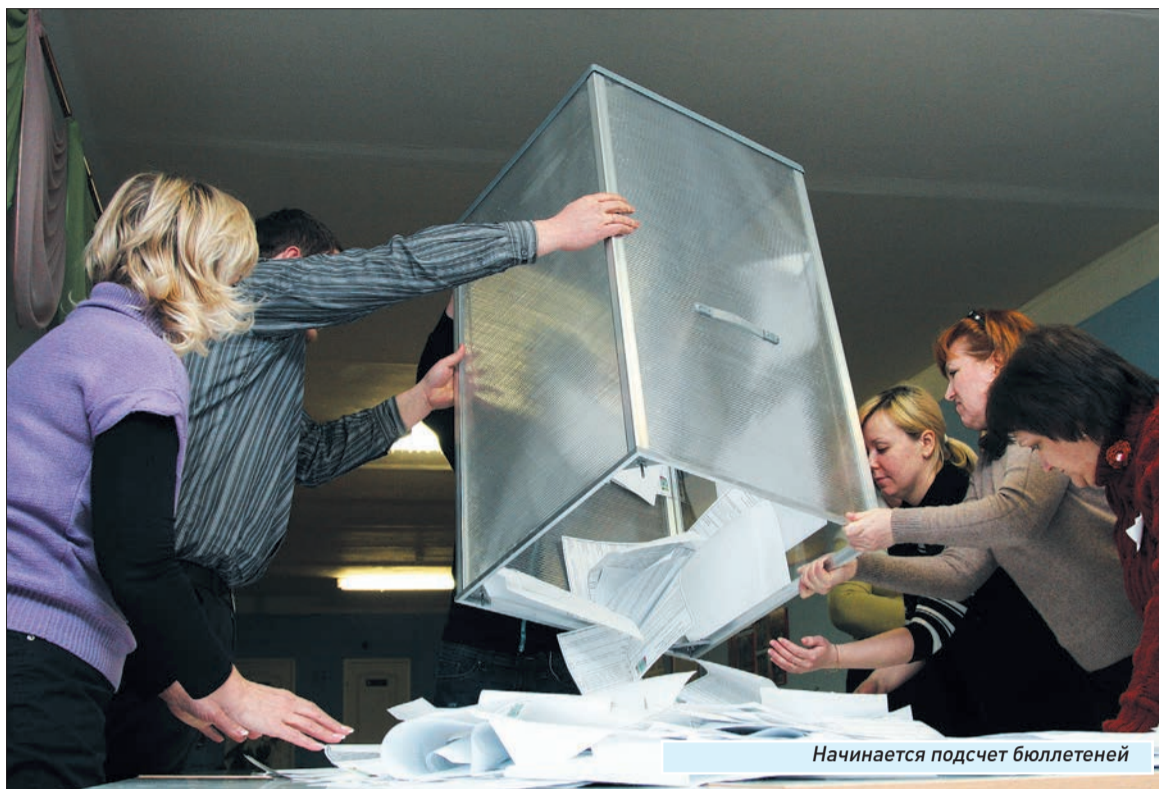
Начинается подсчет бюллетеней