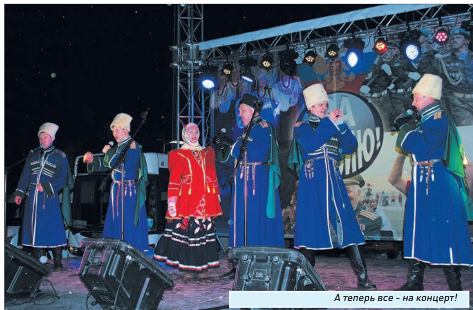
А теперь все - на концерт!