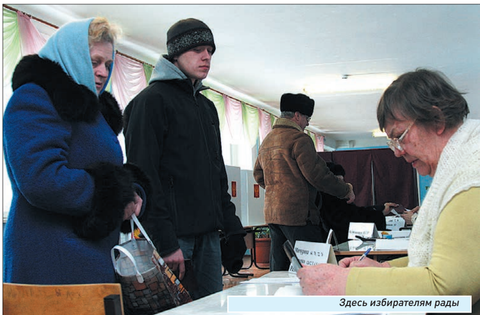
Здесь избирателям рады

Подготовили Оксана БАНИНА, Наталья БЕЛОВА, Лариса ДЯДЯКИНА, Яна ЕМЕЛИНА, Анна ШАЙМАРДАНОВА.