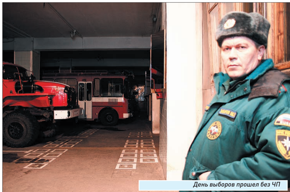
День выборов прошел без ЧП