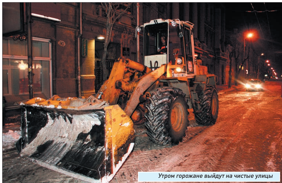
Утром горожане выйдут на чистые улицы

В Самаре в день выборов - без происшествий. В сводках значится: «грубых нарушений общественного порядка, совершения террористических актов, экстремистских проявлений, иных чрезвычайных происшествий в период проведения голосования 4 марта не допущено». В ночь после - тоже. «СТР. 17