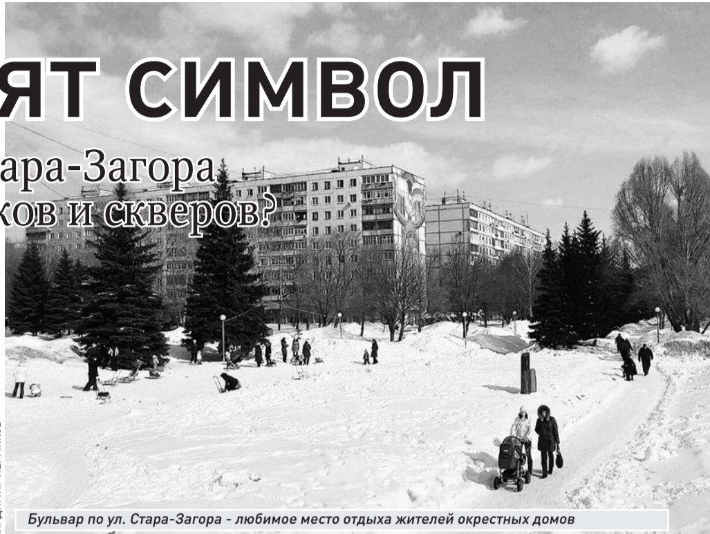
Бульвар по ул. Стара-Загора - любимое место отдыха жителей окрестных домов

Также отказ получило ООО «Время плюс» по дому на ул. Арцыбушевской, 204. Компания планировала поднять этажность здания (с 16-ти до 25-ти). Комиссия даже обсуждать не стала этот объект. Ведь с появлением такого гиганта в разы вырастет нагрузка на инфраструктуру, усилится проблема с парковками. «Нет» сказали и очередному коттеджу на шестой линии Барбошиной поляны. Хозяин построил дом незаконно, а теперь хочет его