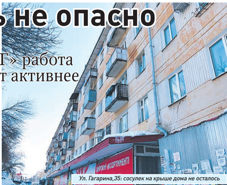
Ул. Гагарина, 35: сосулек на крыше дома не осталось