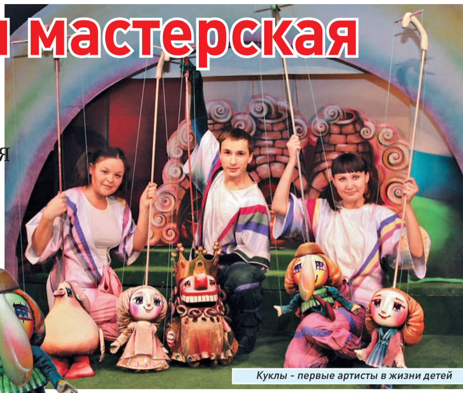
Куклы - первые артисты в жизни детей

...В волшебном полумраке десяток человек снуют туда-сюда с куклами и декорациями. В центре, на высоком помосте, актеры со своими «подопечными», которыми нужно не только управлять, но и озвучивать их. А порой артистам приходится выбегать на сцену и, оставив куклу в руках помощников, отыгрывать музыкальный номер. Потом сломя голову возвращаются на помост, забирая на ходу своего героя, и продолжать действие уже с куклой. И делают это они мастерски,