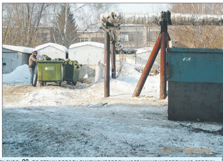
Ул. Ставропольская, 98: по этому адресу ликвидировали несанкционированную свалку