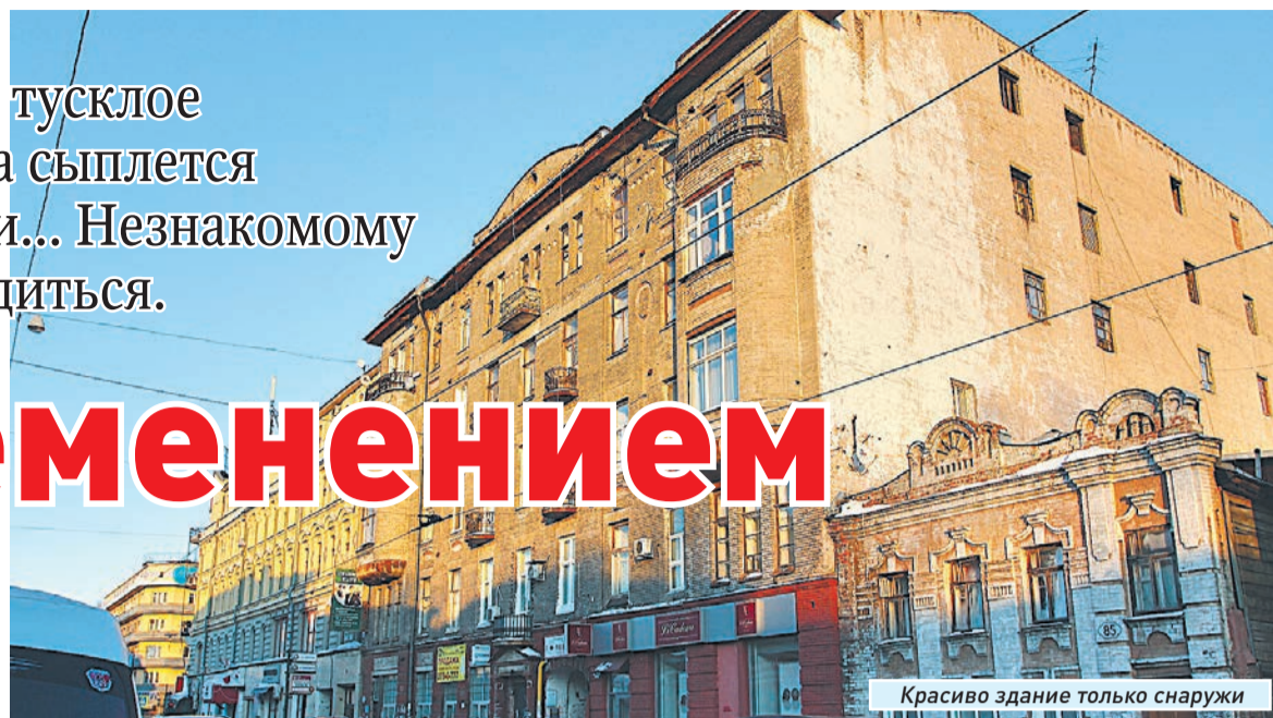
Красиво здание только снаружи