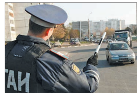
вилам для прохождения ТО она не требуется.

— В каком случае теперь нужна медицинская справка? Ведь по новым пра-