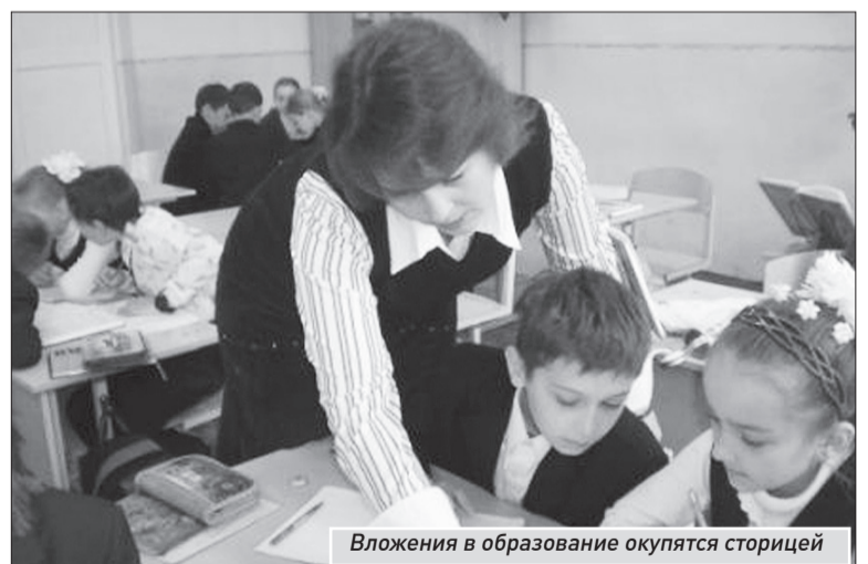
Вложения в образование окупятся сторицей

Второй момент, который обсудили члены общественной комиссии, - поправки в закон о материальной и социальной поддержке учащихся. Предполагается, что ежегодно инвалиды, отличившиеся в учебе, будут получать повышенную стипендию, то есть в 1,5 раза больше обычной. Есть предложение, чтобы