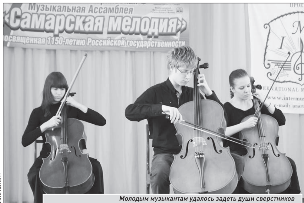
Молодым музыкантам удалось задеть души сверстников

В этом году она была посвящена 1150-летию российской государственности. Организатором по традиции стал департамент по вопросам культуры, спорта, туризма и молодежной политики Самары совместно с Международным музыкальным проектом «Гилельс-Коган» и Молодежной академической филармонией Москвы.