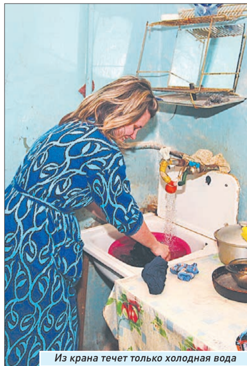
Из крана течет только холодная вода