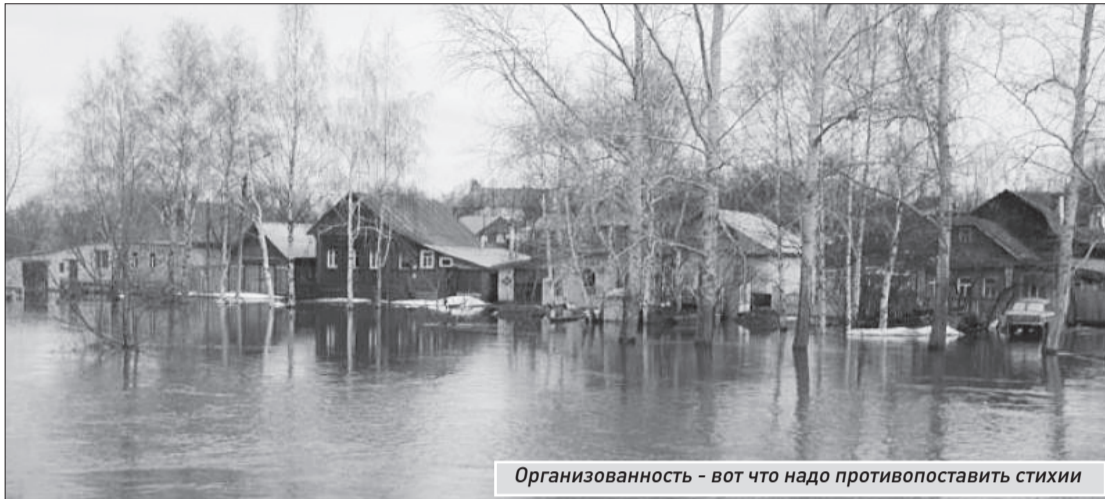
Организованность - вот что надо противопоставить стихии