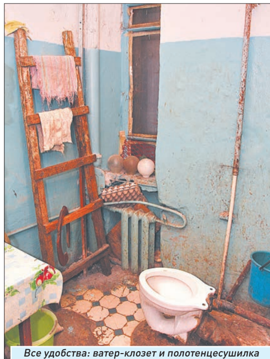
Все удобства: ватер-клозет и полотенцесушилка