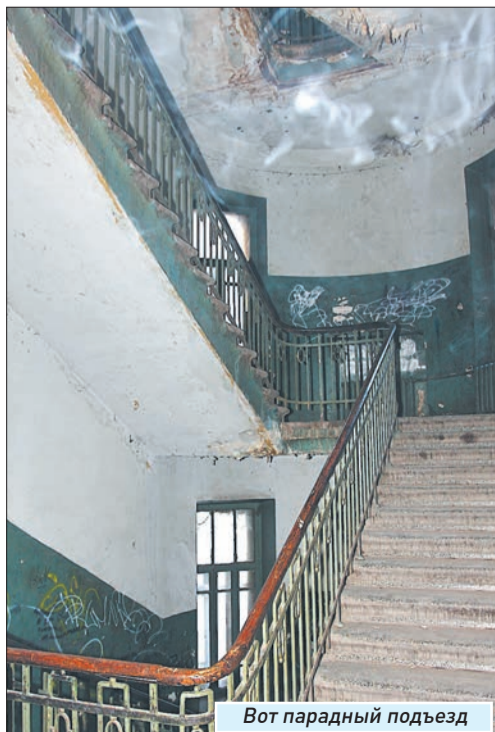
Вот парадный подъезд

В архитектурном бюро «Остоженка» мы разработали программу по сохранению Старой Самары, — рассказал главный архитектор Самары Виталий Стадников . — Теперь наша общая задача — преобразить ее в регламент правил застройки. От этого зависит и сохранение исторической среды города. Что касается спасения конкретного объекта, мы должны создать механизм, чтобы появился интерес у инвесторов, которые бы взяли на себя расходы по приведению зданий в порядок.