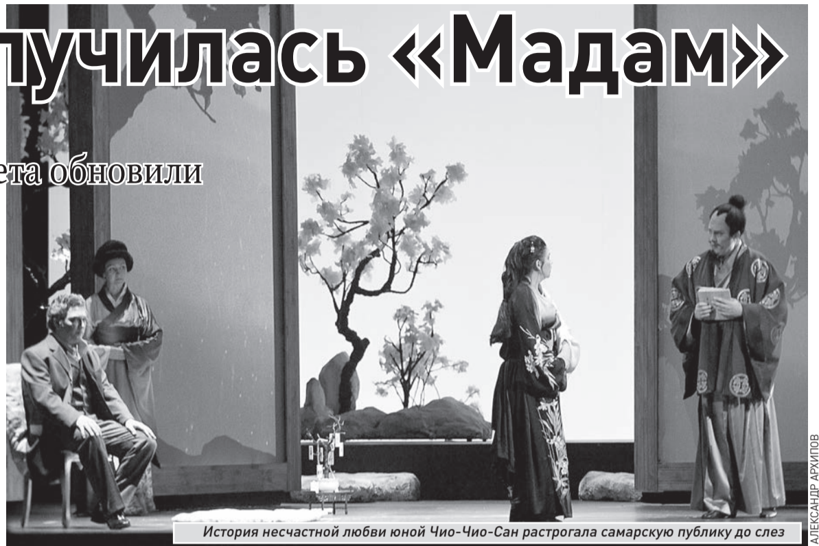
История несчастной любви юной Чио-Чио-Сан растрогала самарскую публику до слез

«Сам я ставлю эту оперу впервые, – признался в одном из недавних интервью режиссер. – И очень доволен, что работаю с самарской труппой. При этом не вижу никаких проблем в том, что артисты поют на итальянском. Конечно, легче разговаривать на иностранном языке, чем петь, но нам очень помогает