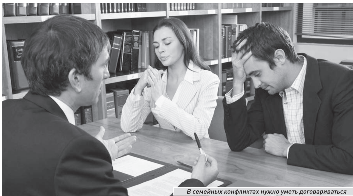
В семейных конфликтах нужно уметь договариваться

В общем, как говорится, не забалуешь... Но несмотря на все строгости ко второй половине прошлого века выяснилось, что суды буквально «упонули» в бракоразводных процессах. А количество граждан, проходящих