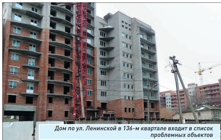
Дом по ул. Ленинской в 136-м квартале входит в список проблемных объектов