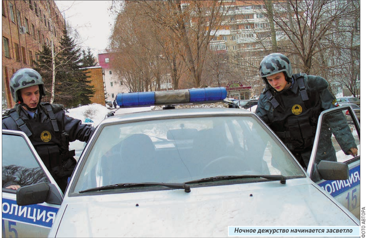
Ночное дежурство начинается засветло

А что касается нашумевших в городе дел, так, во время дежурства именно этой группы