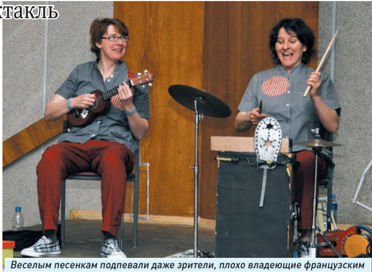
Веселым песенкам подпевали даже зрители, плохо владеющие французским

А на следующий день состоялись три мастер-класса. Приглашение на один из них под на-