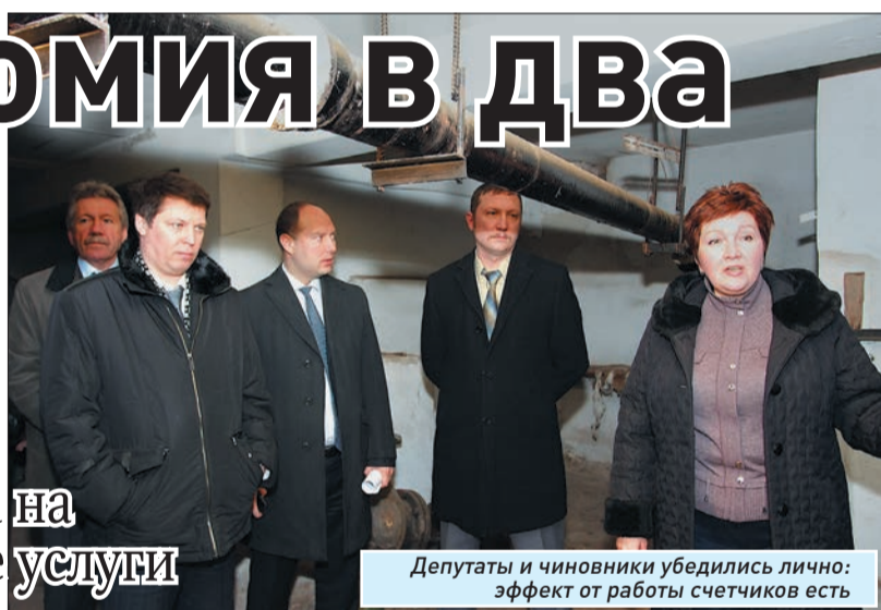
Депутаты и чиновники убедились лично: эффект от работы счетчиков есть