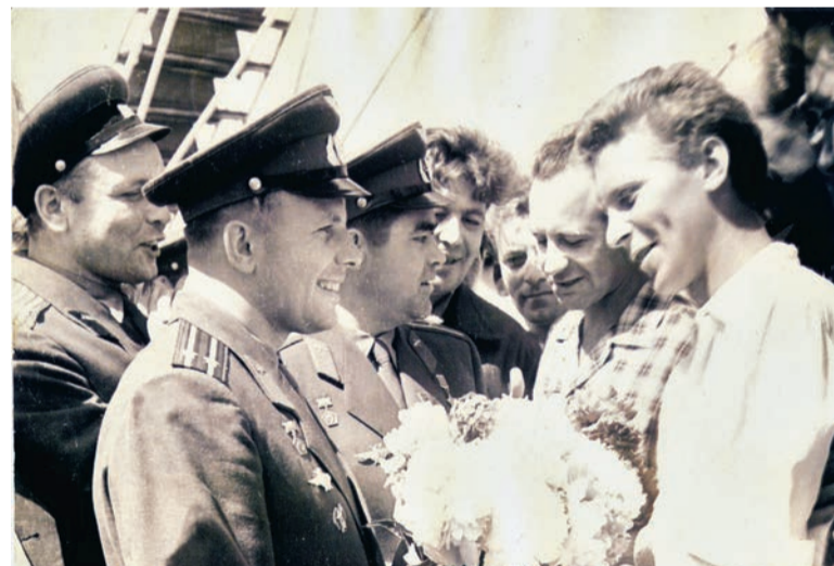
Ю.Гагарин на заводском аэродроме во время встречи В.Терешковой и В.Быковского 13.06.63 г.

На подлете к Внуково пассажирский Ил-18 сопровождали семь истребителей. Таких же, на которых Гагарин начинал свой путь в реактивную авиацию. Потом было выступление на митинге на Красной площади. Первому космонавту ставилось строгое условие: по бумажке не читать! И с этим заданием Гагарин справился без труда. Позднее из кинохроники беспощадно выреза-