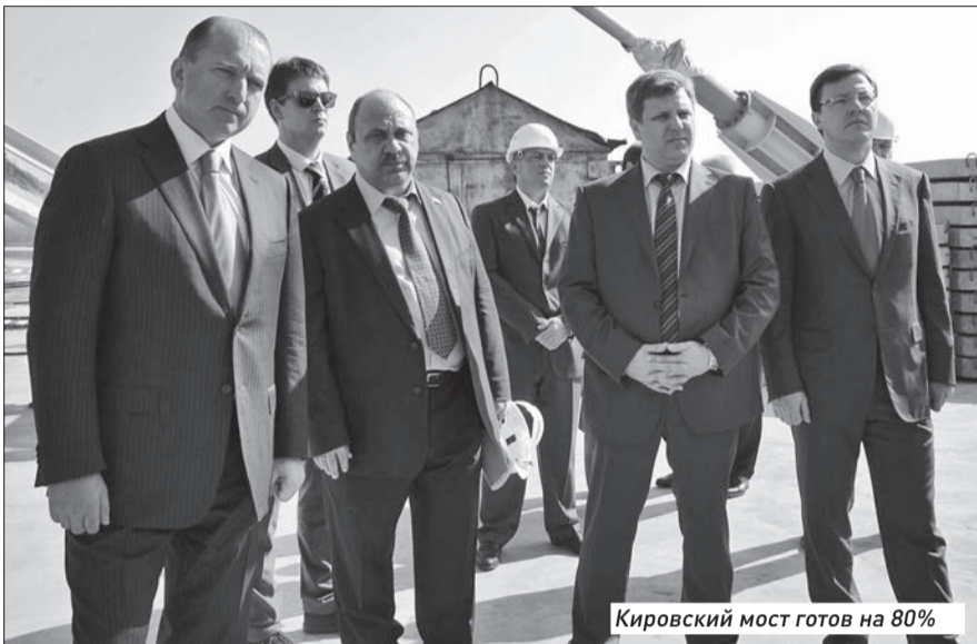
Кировский мост готов на 80%