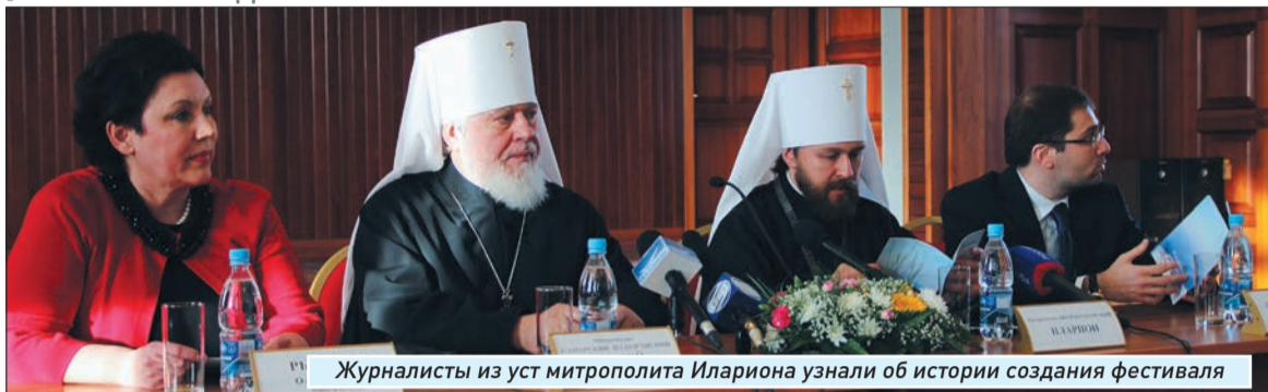
Журналисты из уст митрополита Илариона узнали об истории создания фестиваля