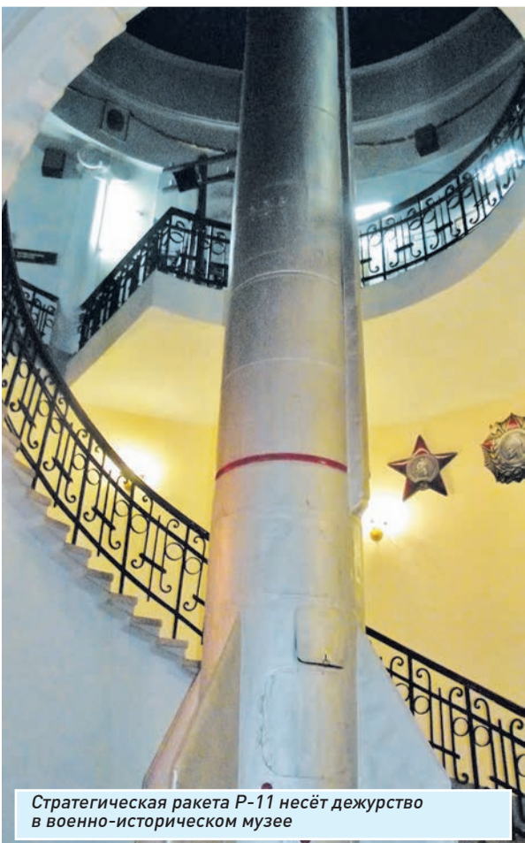
Стратегическая ракета Р-11 несёт дежурство в военно-историческом музее

Космос начинал осваиваться военными. Все космонавты первых десятилетий и в России, и за рубежом были боевыми лётчиками. Четырнадцать космонавтов были офицерами Приволжского военного округа. Именно им посвящается экспозиция, которая сейчас формируется в военно-историческом музее. В экспозицию войдут личные вещи космонавтов, уникальные фотографии, а также предметы космического быта. В частности только здесь можно будет увидеть, как выглядит обычная посылка из космоса на Землю. Здесь можно будет увидеть планшеты и телеграммы первого космонавта Земли Юрия Гагарина, посмотреть работы художников. Музей рассказывает о военной истории страны и края с середины 19 века до наших дней, и тема военного космоса неотъемлемая её часть. Открытие экспозиции намечено на май 2012 года. К слову, в музее хранится уникальная боевая ракета, собранная ещё в докосмическую эпоху. Посетить музей в любое время можно только в воскресенье с 10.00 до 16.00. В среду, четверг и пятницу проводятся только групповые посещения для школьников, студентов и организаций. Музей находится по адресу ул. Шостаковича, 1 (бывшая Рабочая), в районе Струковского сада.