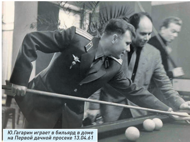
Ю.Гагарин играет в бильярд в доме на Первой дачной просеке 13.04.61