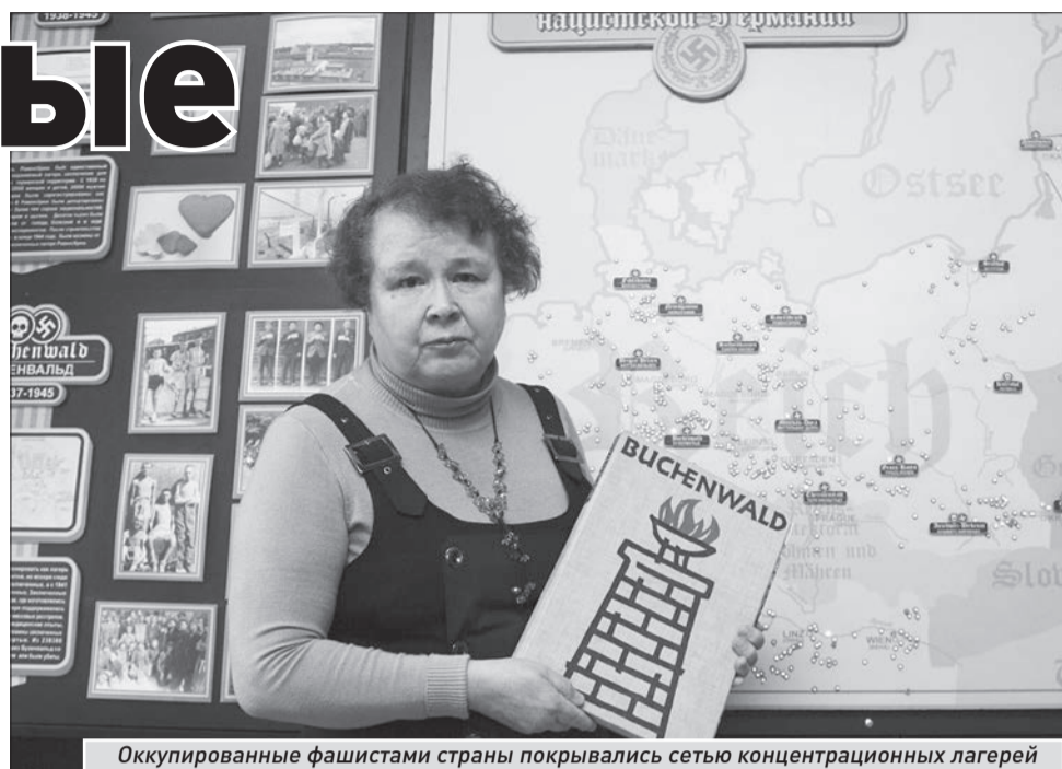
Оккупированные фашистами страны покрывались сетью концентрационных лагерей