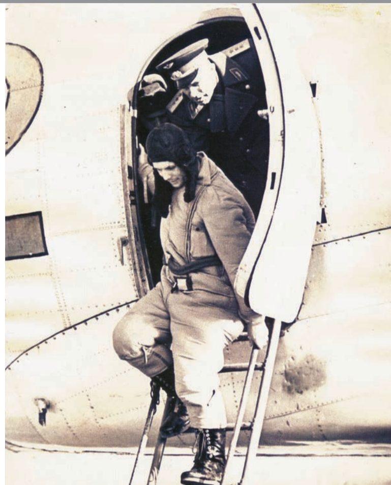
Ю.А.Гагарин и Ф.А.Агальцов на заводском аэродроме 12.04.61.

Гагарина отвезли на дачу сотрудников областного комитета партии, находящуюся у Волги, на Первой просеке. Здесь космонавта обследовали врачи. Затем он пообедал после полета и отдыхал до следующего дня. Во время недолгих часов отдыха на обкомовской даче Юрий Гагарин играл в бильярд, отдыхал, гулял по берегу Волги, общался с медиками, журналистами, коллегами. Для Гагарина организовали прогулку по Волге. Катер был небольшой, поехали человек восемь-десять. Переехали на правый берег, разожгли костер. Была скромная закуска, минералка и водка. На