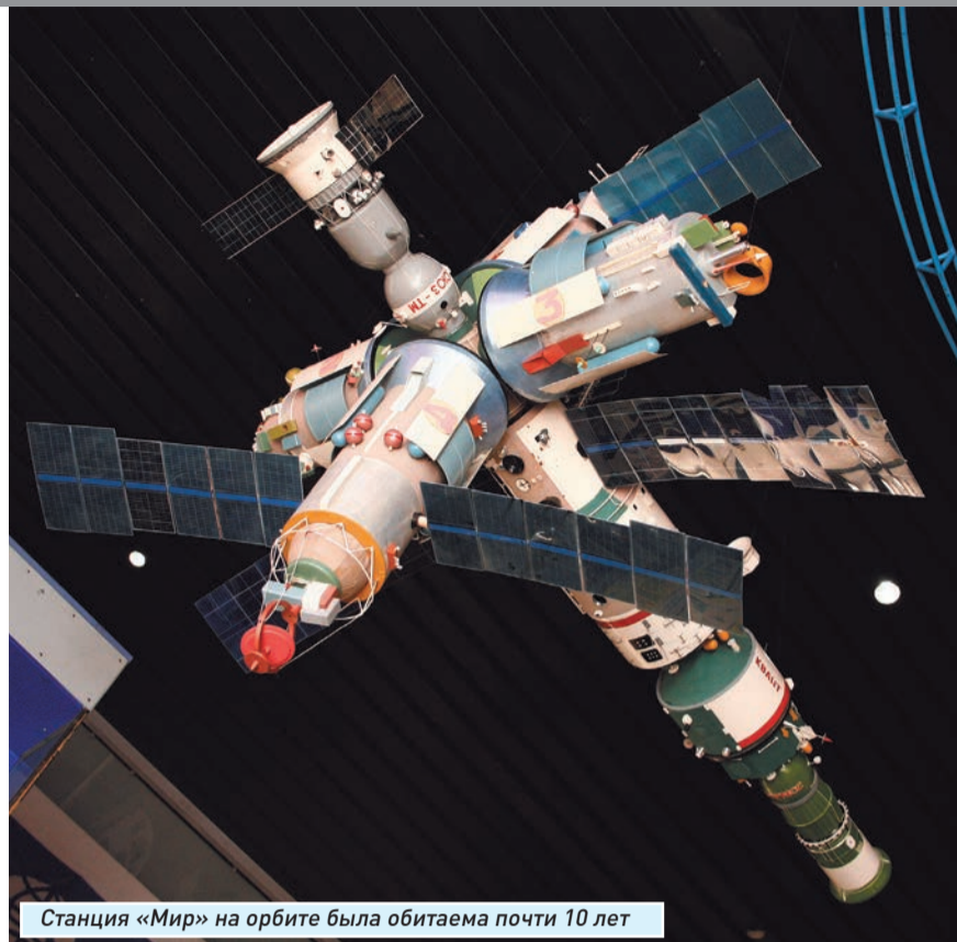
Станция «Мир» на орбите была обитаема почти 10 лет

Космос начинал осваиваться военными. Все космонавты первых десятилетий и в России, и за рубежом были боевыми лётчиками. Четырнадцать космонавтов были офицерами Приволжского военного округа. Именно им посвящается экспозиция, которая сейчас формируется в военно-историческом музее. В экспозицию войдут личные вещи космонавтов, уникальные фотографии, а также предметы космического быта. В частности только здесь можно будет увидеть, как выглядит обычная посылка из космоса на Землю. Здесь можно будет увидеть планшеты и телеграммы первого космонавта Земли Юрия Гагарина, посмотреть работы художников. Музей рассказывает о военной истории страны и края с середины 19 века до наших дней, и тема военного космоса неотъемлемая её часть. Открытие экспозиции намечено на май 2012 года. К слову, в музее хранится уникальная боевая ракета, собранная ещё в докосмическую эпоху. Посетить музей в любое время можно только в воскресенье с 10.00 до 16.00. В среду, четверг и пятницу проводятся только групповые посещения для школьников, студентов и организаций. Музей находится по адресу ул. Шостаковича, 1 (бывшая Рабочая), в районе Струковского сада.