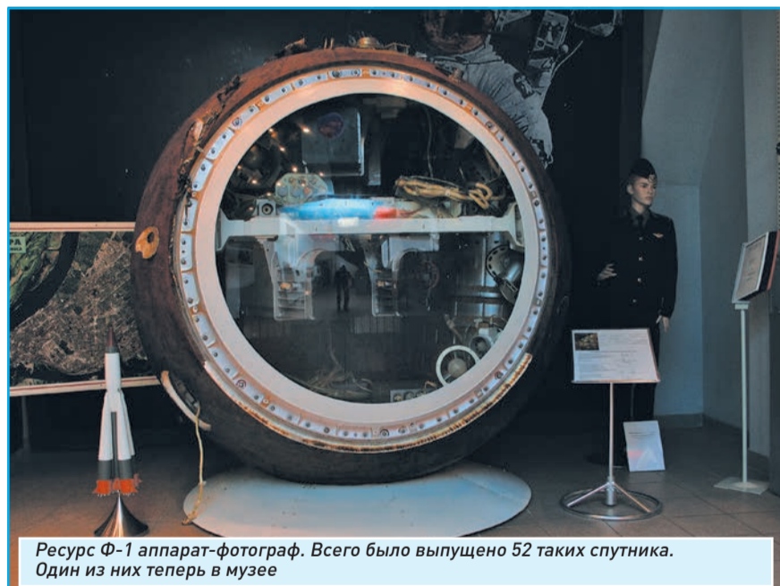
Ресурс Ф-1 аппарат-фотограф. Всего было выпущено 52 таких спутника. Один из них теперь в музее

Проследить историю космонавтики с самых первых лет авиации до наших дней можно только в одном месте – музее авиации и космонавтики Самарского государственного аэрокосмического университета. Здесь есть все начиная от макета самого первого самолета и заканчивая последними разработками спутников, которые находятся на орбите. Только здесь можно увидеть спускаемую капсулу первого спутника-шпиона, созданного в ГНПРКЦ «ЦСКБ-Прогресс», а также макет легендарной станции «Мир», предшественницы нынешней международной космической станции. Здесь же можно сфотографироваться в гермошлеме и кабине боевого истребителя. Видеофонд музея содержит более 300 российских и зарубежных фильмов, в числе которых такие уникальные, как хроника испытательных пусков ракетно-космического комплекса Н1-Л3, документальные кадры испытаний первых отечественных реактивных самолетов, экранопланов и другие. 14 апреля в музее СГАУ день открытых дверей , поэтому его можно посетить в любое время с 11.00 до 17.00. В остальные дни посещение осуществляется только в составе группы. Музей находится по адресу Московское шоссе, 34а.