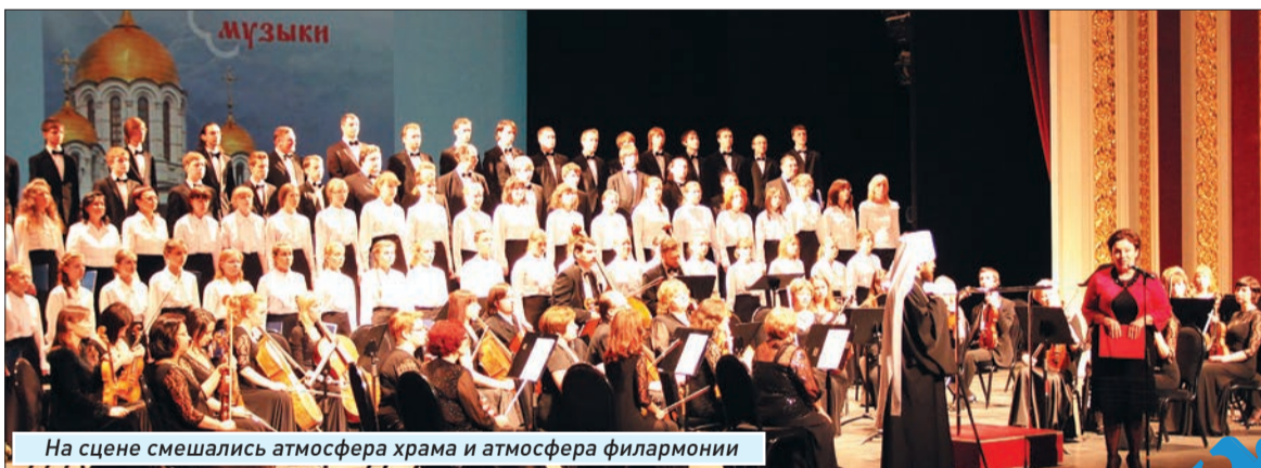
На сцене смешались атмосфера храма и атмосфера филармонии

– Наша идея – перенести на сцену атмосферу православного храма, чтобы чтение Евангелия, истории о страстях Христовых, чередовалось с музыкальными номерами. В основе либретто – текст Евангелия от Матфея. В музыкальном сопровождении можно найти мотивы и одноименного произведения Иоганна Себастьяна Баха, и отголоски русской церковной традиции знаменного пения и церковного пения XIX века. Надеюсь, слушатели почувствуют дух молитвенного поклонения страждущего Спасителя.