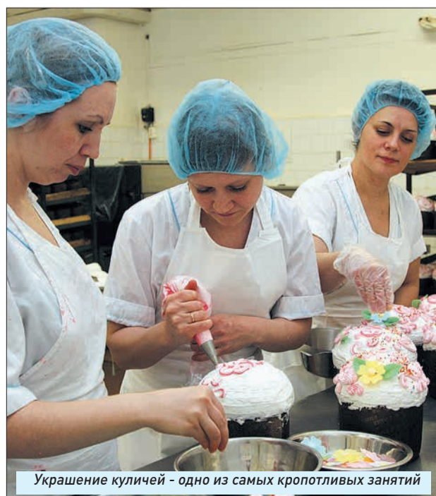
Украшение куличей — одно из самых кропотливых занятий