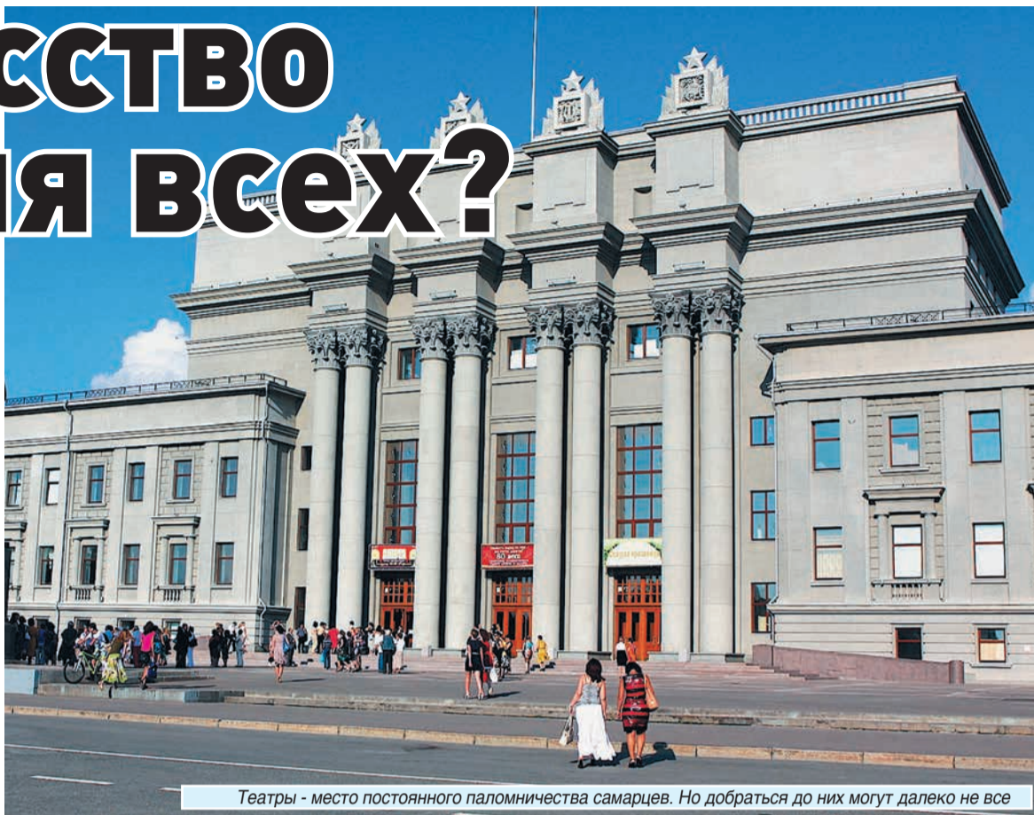
Театры – место постоянного паломничества самарцев. Но добраться до них могут далеко не все