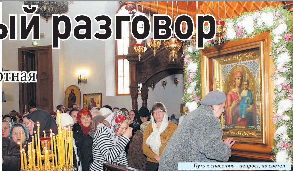
Путь к спасению — непрост, но светел

Я долго работала психотерапевтом, окончила курс групповой и семейной психотерапии в Москве, освоила технику психодрамы. Практиковала в этих направлениях, но постоянно возникало ощущение, что чего-то не хватает. И очень благодарна Богу, что попала на теологический факультет при Самарской гуманитарной академии. Нас, слушателей, это заставило воцерковиться настолько, чтобы мы поняли, что такое исповедь, причастие, как важно к ним подготовиться, как важно соблюдать пост. Тогда для меня открытием стало учение святого Максима — исповедника о падшей стороне личности. Мы созданы по образу Божьему, но есть в человеке и падшая сторона личности — страстность, смертность, тленность... Да, земная жизнь у нас конечна. Но почему мы так боимся смерти? Диакон Андрей Кураев легко отвечает на этот вопрос: мы созданы для вечности, смерть — это противоестественно, это появилось после грехопадения человека. Мы