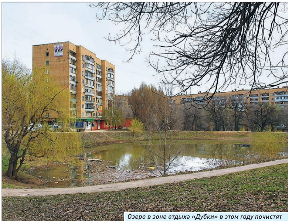
Озеро в зоне отдыха «Дубки» в этом году почилят