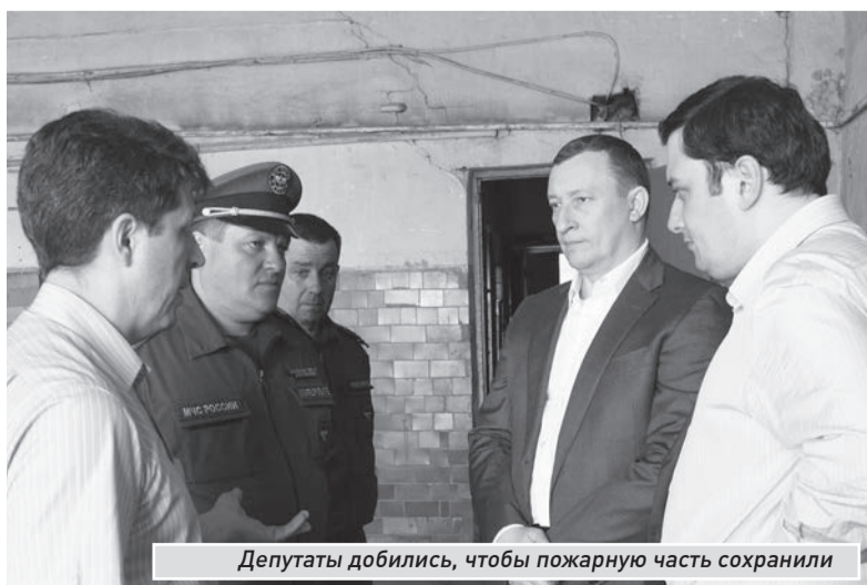
Депутаты добились, чтобы пожарную часть сохранили