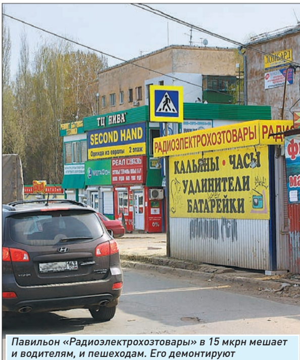
Павильон «Радиоэлектротовары» в 15 мкр-н мешает и водителям, и пешеходам. Его демонтируют

- Утепление стен угловых квартир №№ 13, 63, 66, 72, 75 общей площадью 114 кв. м запланировано на август этого года.