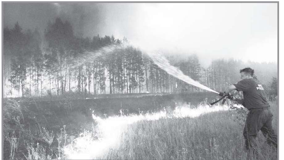
ПОЖАРЫ В ЛЕСАХ И НА ТОРФЯНИКАХ

В результате депутаты решили, что нужно разработать собственное положение, регулирующее деятельность ТОСов, и их финансирование. Это поручение в ближайшее время поступит в комитет по местному самоуправлению.