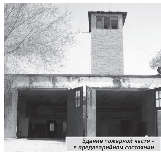
Здание пожарной части — в предаварийном состоянии