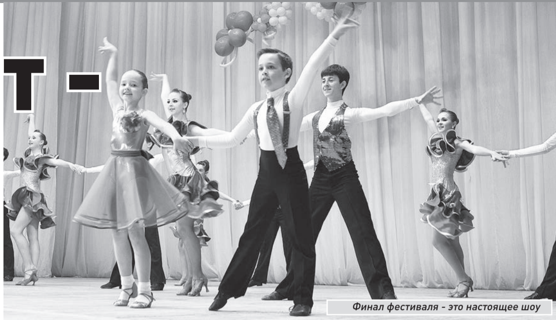
Финал фестиваля - это настоящее шоу