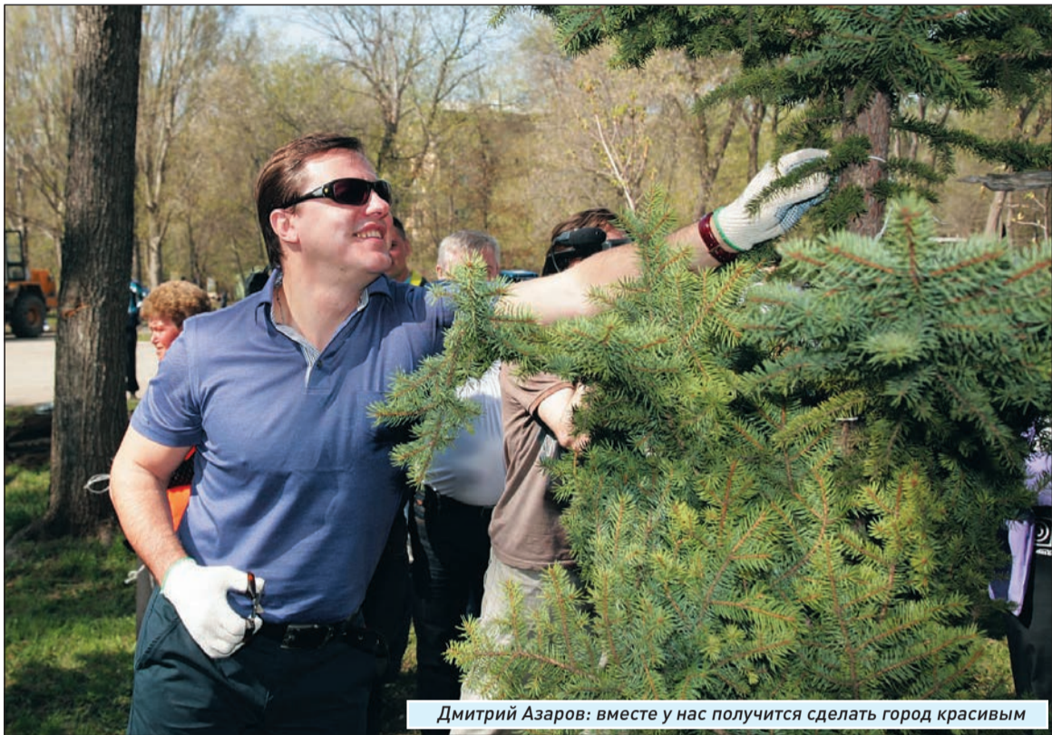
Дмитрий Азаров: вместе у нас получится сделать город красивым