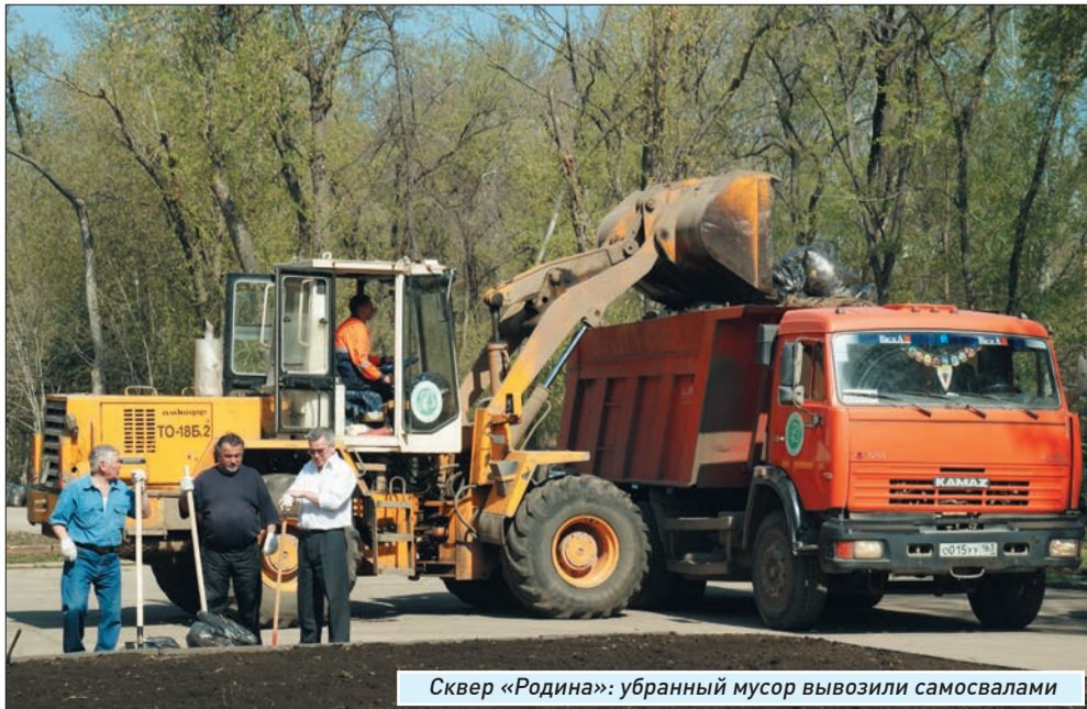
Сквер «Родина»: убраный мусор вывозили самосвалами