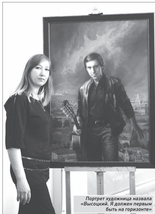
Портрет художница назвала «Высоцкий. Я должен первым быть на горизонте»

Кстати, в мае исполнится 45 лет со дня выступления Владимира Высоцкого в самарском Дворце спорта. Это был один из первых концертов, где любимому народом поэту и певцу пришлось предстать перед семитысячной аудиторией, один из первых его шагов на пути к народному признанию.