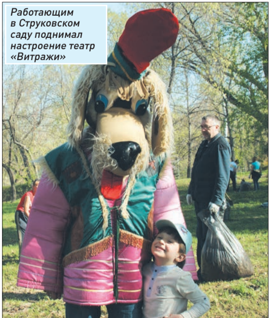
Работающим в Струковском саду поднимал настроение театр «Витражи»