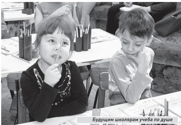
Будущим школярам учеба по душе

А летом все лауреаты фестиваля традиционно отправятся в путешествие до Волгограда на теплоходе.