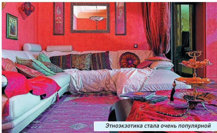
Этноэкзотика стала очень популярной

С каждым годом все большее распространение получает экологический стиль. На смену эйфории от появления новых суперматериалов приходит желание жить в безвредном для