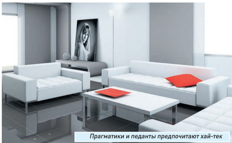
Прагматики и педанты предпочитают хай-тек

Давайте теперь поговорим о современных стилях в дизайне помещений. Без сомнения, фаворитом среди них является хай-