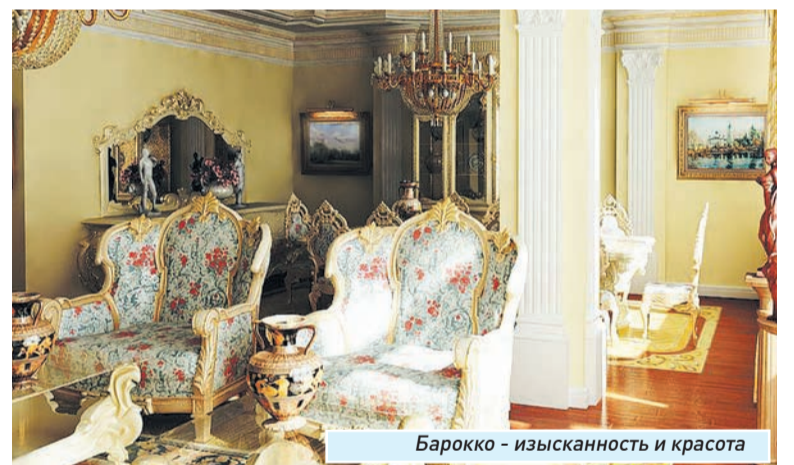
Барокко - изысканность и красота