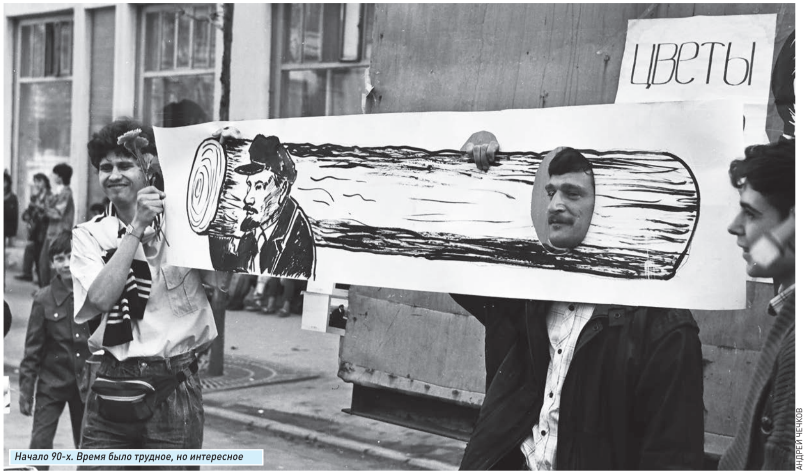
Начало 90-х. Время было трудное, но интересное

19 августа, уже во второй половине дня, на ряде самарских предприятий проходили импровизированные митинги, на улицах стояли пикеты, организованные демократическими силами. С другой стороны командующий Приволжским военным округом генерал Макашов - одиозная личность, неудавшийся кандидат в президенты. Альберт Михайлович гонял по улицам бронетранспортеры. Около телецентра и в Доме печати были выставлены усиленные офицерские патрули.