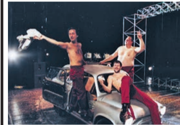
«НАШ ГОРОДОК» «Самарская площадь», 18:30