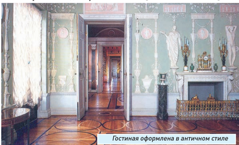
Гостиная оформлена в античном стиле

Для тех, кто предпочитает «королевский» стиль, современный рынок тоже предлагает все необходимое. Под «королевским» стилем мы условно объединим такую классику как ренессанс, барокко, рококо, ампир. Безусловно, у каждого из них много существенных отличий, но общая атмосфера интерьера едина - стремление к изысканной красоте, роскоши, блеску. В первую очередь настроение таких «королевских» интерьеров передают элементы лепнины на потолке, использование позолоты,