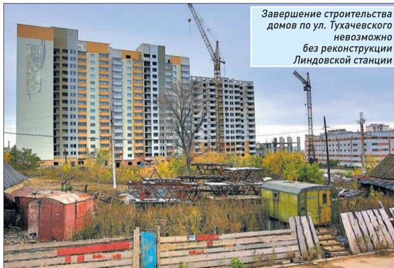
Завершение строительства домов по ул. Тухачевского невозможно без реконструкции Линдовской станции