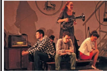
LADIES' NIGHT (комедия) Театр драмы, 18:00

«ДОРОГА В ВИФЛЕЕМ» (библейская притча) «Актерский дом», 11:00, 13:00 «ПТИЦА ФЕНИКС ВОЗВРАЩАЕТСЯ ДОМОЙ» «СамАрт», 14:00