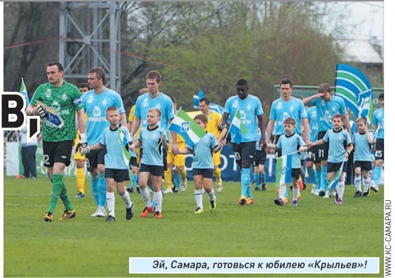
Эй, Самара, готовься к юбилею «Крыльев»!

- Непременно. В наших планах замена травяного покрова и обновление дренажной системы на главном поле стадиона «Металлург», установление подогрева на втором поле, укладка искусственного газона на третьем поле, а также окончание ремонта полей на базе «Крыльев Советов». Эти работы должны быть завершены к началу июля. Дело в том, что мы не отказываемся от планов принять в середине июля на «Металлурге» матч за Суперкубок России. В нем встретятся чемпион России сезона 2011/12 годов и обладатель Кубка страны. Самара является одним из главных претендентов на проведение Суперкубка. К этому событию мы дополнительно оборудуем на Западной трибуне еще две ВИП-ложи.