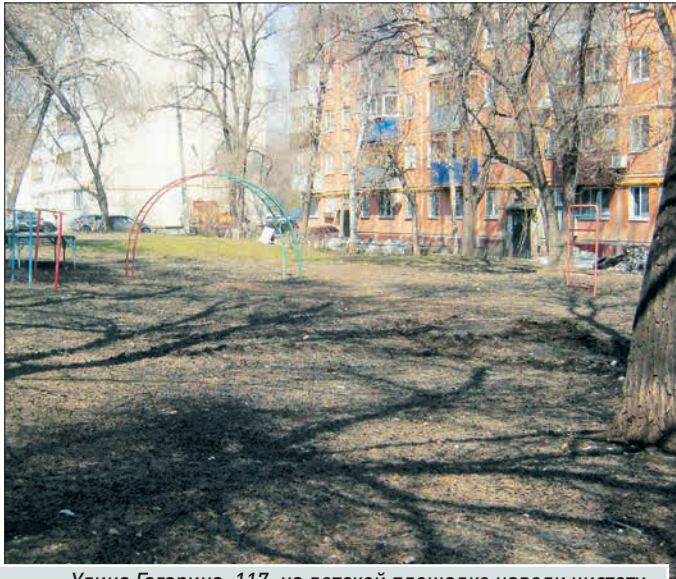
Улица Гагарина, 117: на детской площадке навели чистоту