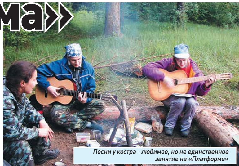
Песни у костра – любимое, но не единственное занятие на «Платформе»

Абсолютно уникальным явлением станет сольный концерт Михаила Щербакова. Это одна из самых загадочных фигур в бардовском движении. Его песни любимы и знакомы многим. Но часто, напевая у костра «Давайте, други милые, буяннить и шалить...», туристы даже не подозревают, что автором этих строк является Михаил Щербаков. Он не ездит по фестивалям, не участвует в телевизионных шоу, его песни передаются «из рук в