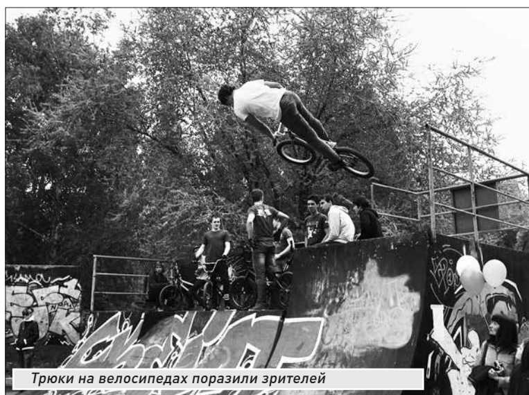
Трюки на велосипедах поразили зрителей