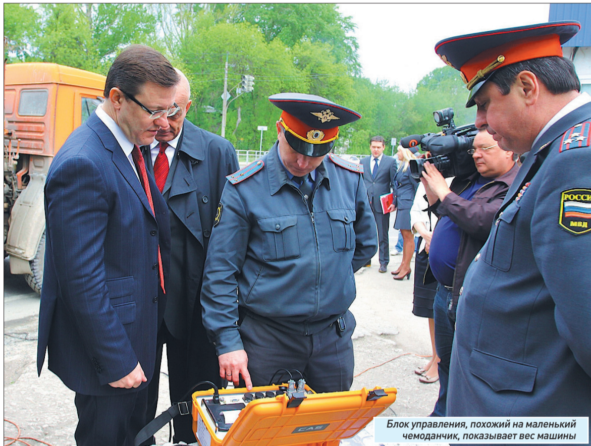
Блок управления, похожий на маленький чемоданчик, показывает вес машины

Тут весы начинают работать. Датчики в платформах воспринимают нагрузку от колес и отправляют информацию в блок управления. Он стоит рядом и выглядит как маленький чемоданчик. Обработав сигнал, блок показывает на экране нагруз-