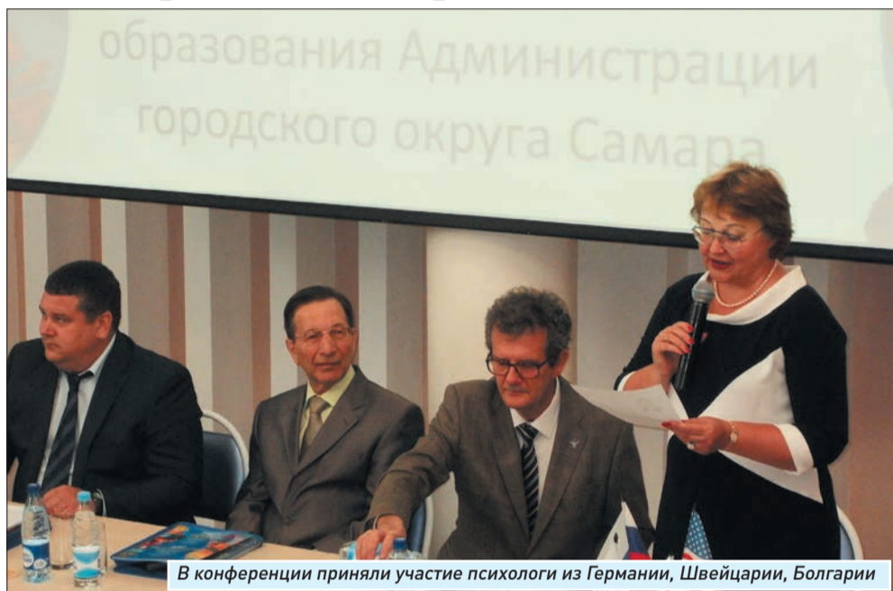
В конференции приняли участие психологи из Германии, Швейцарии, Болгарии

Тема научного форума оказалась весьма востребованной. Поскольку, как бы ни различались системы психологической семейной и школьной поддержки в Европе, США и России, оказалось, что проблемы у подрастающего поколения по большому счету схожие, да и кризисы возраста тоже. И хотя