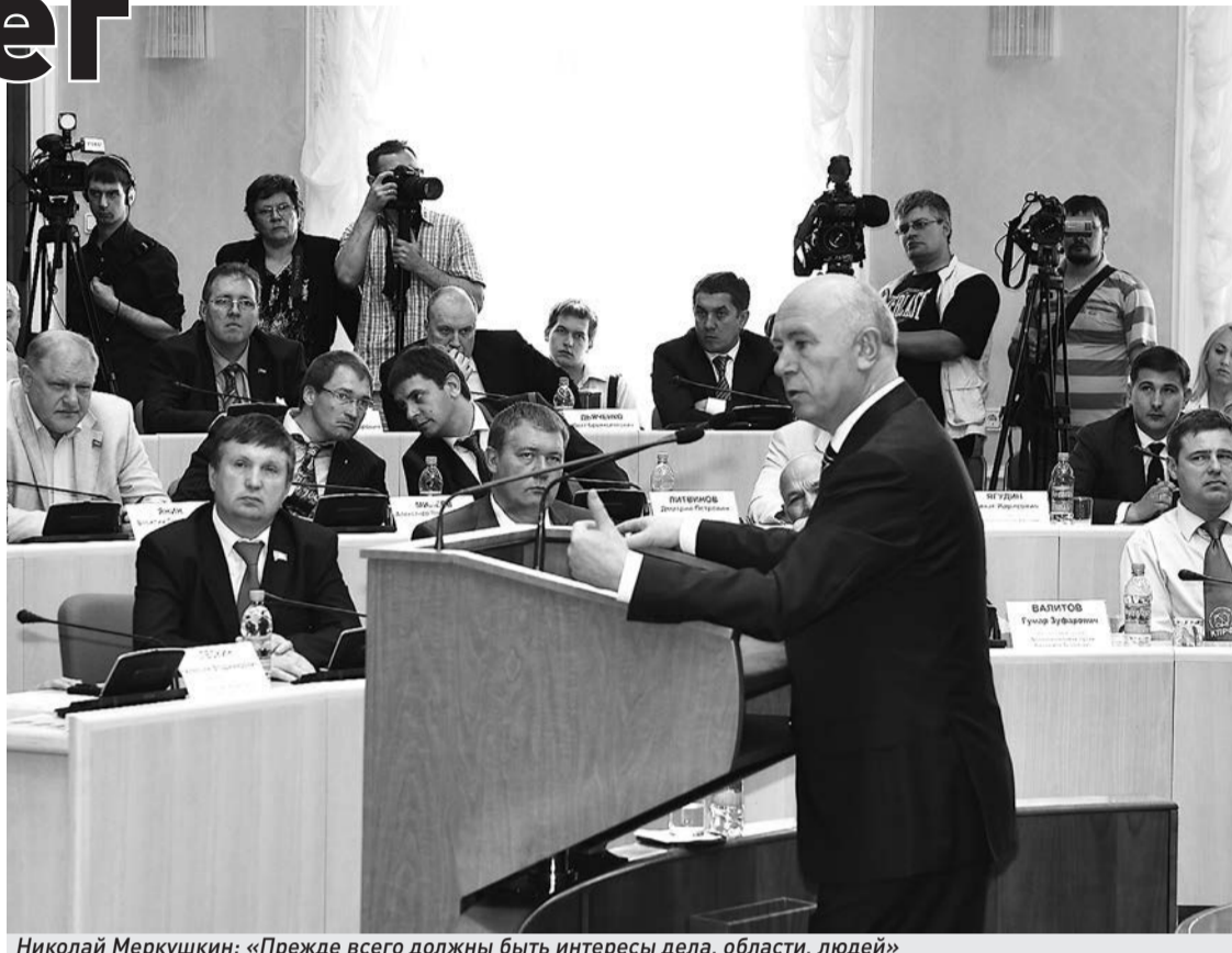
Николай Меркушкин: «Прежде всего должны быть интересы дела, области, людей»

Бабич подчеркнул: «На всех этапах профессиональной деятельности работа Николая Ивановича была связана только с одним — служением государству. И на всех этапах есть конкретные и положительные результаты». Внося кандидатуру Меркушкина, по словам Бабича, президент руководствовался его заслугами перед государством, результатами, знаниями, хозяйственным опытом. Полпред отметил: губернаторы Константин Титов и Владимир Артяков сделали многое для развития области, и этот потенциал нуж-