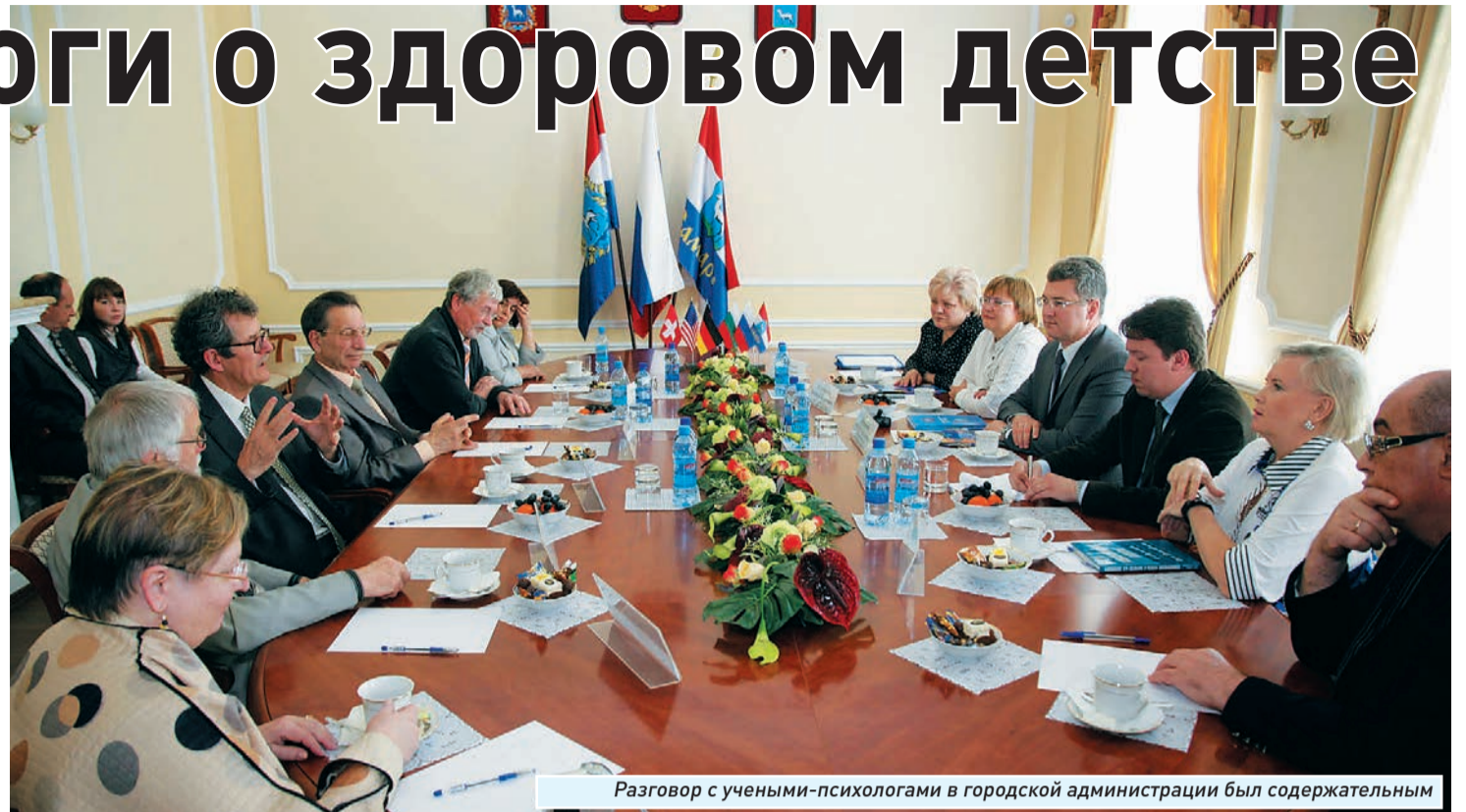
Разговор с учеными-психологами в городской администрации был содержательным

Своим опытом и наработками с самарцами поделились ведущие отечественные и зарубежные ученые. В общей сложности в мероприятиях конференции участвовало около 300 человек.