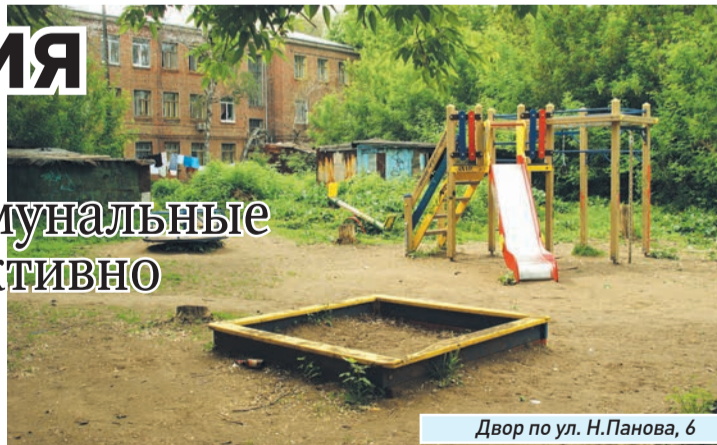
Двор по ул. Н.Панова, 6

Недавно ситуация во дворе наконец изменилась в лучшую сторону. Городские службы вывезли мусор, лежавший возле гаражей.