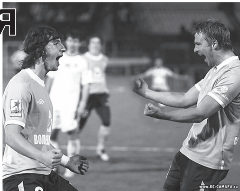
Спасибо, «Крылья», что сохранили для футбольной Самары большой футбол!

«Крыльям Советов» победа в этом матче была нужна позарез. Только она служила пропуском на спасительное 12-е место в турнирной таблице, чтобы избежать нервотрепки в переходных встречах.