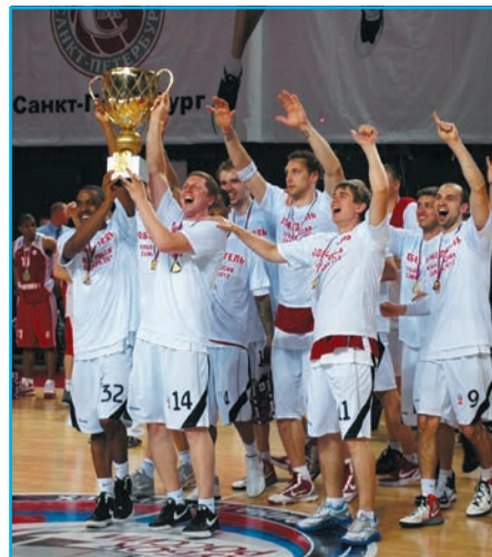
Кубок России остался в Самаре стр. 7