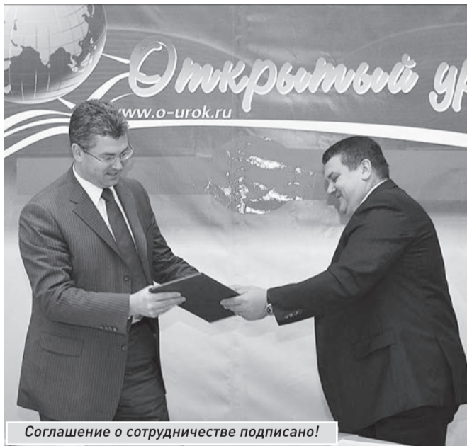
Соглашение о сотрудничестве подписано!