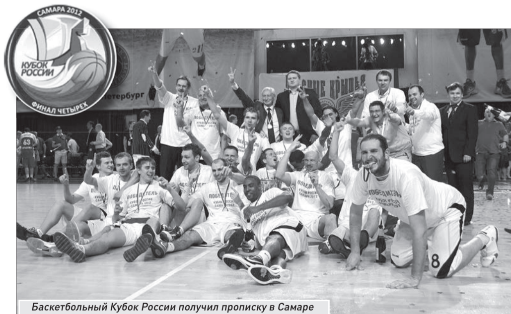
Баскетбольный Кубок России получил прописку в Самаре

Сегодня финалисты Кубка России вновь выйдут на паркет «МТЛ-Арены» уже в рамках плей-офф чемпионата ПБЛ в борьбе за 7-е место чемпионата страны. Матчи состоятся 15 мая в Самаре (18.00), а также 18 и 19 мая (если потребуются) во Владивостоке.