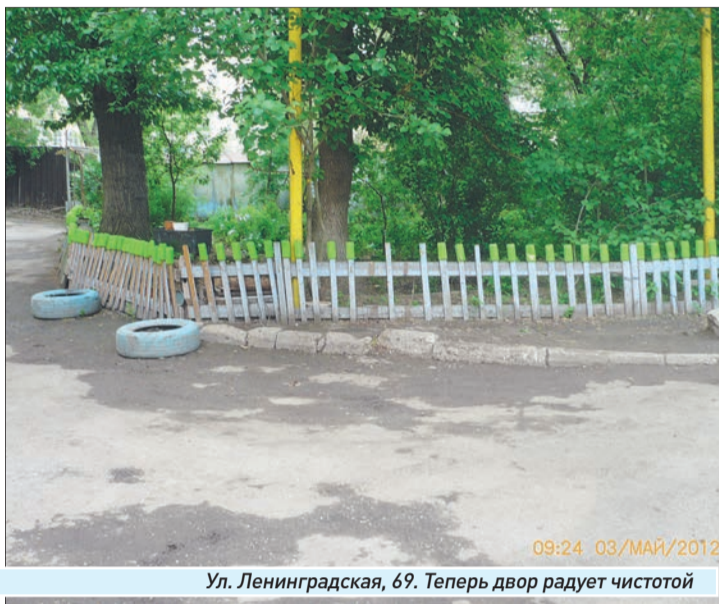
Ул. Ленинградская, 69. Теперь двор радует чистотой