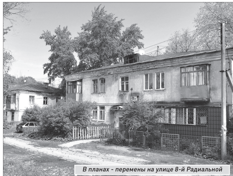
В планах - перемены на улице 8-й Радиальной