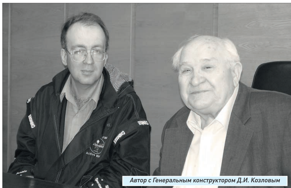
Автор с Генеральным конструктором Д.И. Козловым

В принципе, можно считать, что МБР Р-7 успешно выполнила то, для чего в итоге