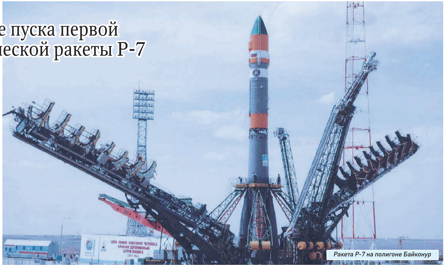
Ракета Р-7 на полигоне Байконур

Эскизное проектирование первой отечественной межконтинентальной баллистической ракеты Р-7 практически было начато в 1953 году. Какие ставились исходные задачи для «семерки»? Дальность полета должна была быть такова, чтобы поразить вероятного противника, который находится на другой половине земного шара. Полезная нагрузка – конечно, атомная бомба. Поскольку «голова» для Р-7 на тот момент еще не существовало, разработчики могли только прикинуть массу на основе тех ориентировочных данных, которые представляли сотрудники И.В. Курчатова.