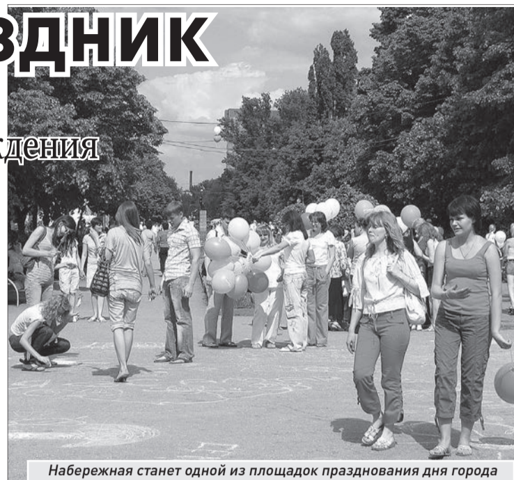
Набережная станет одной из площадок празднования дня города