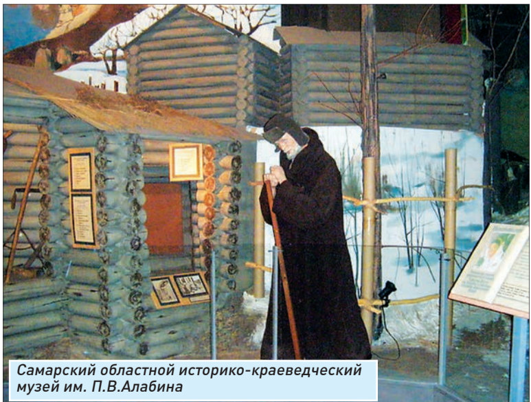
Самарский областной историко-краеведческий музей им. П.В.Алабина

Разумеется, все знают о музее имени Алабина, домах-музеех Ульяновых, Толстых, Горького, Фрунзе. Нельзя не признать, что интерес публики привлекают и художественный музей, и Музей истории войск ПриВО. Но перечисленное - лишь, как принято говорить, вершина айсберга.