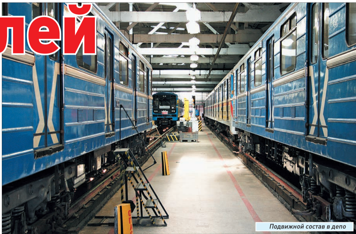
Подвижной состав в депо

от графика – повод для разбирательства. А простой поезда свыше пяти минут – это ЧП и отчетный случай. Регламент метрополитена исчисляется секундами.