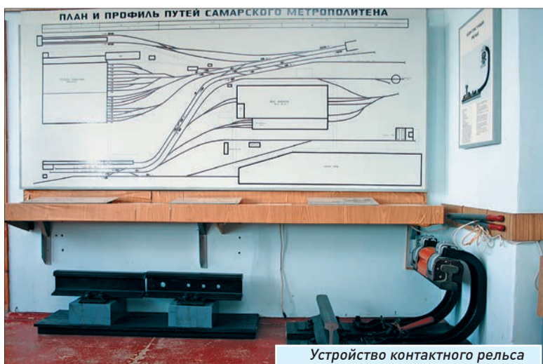
Устройство контактного рельса