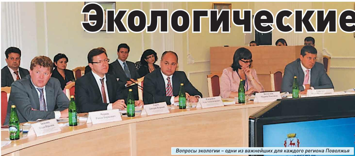
Вопросы экологии – одни из важнейших для каждого региона Поволжья