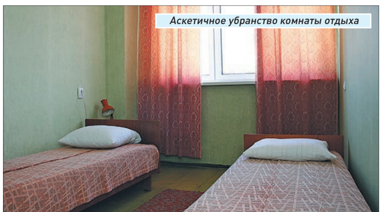
Аскетичное убранство комнаты отдыха

Пожелаем ему чистых рельсов, поменьше непредвиденных случаев, и чтобы слева по поезду всегда было без замечаний.