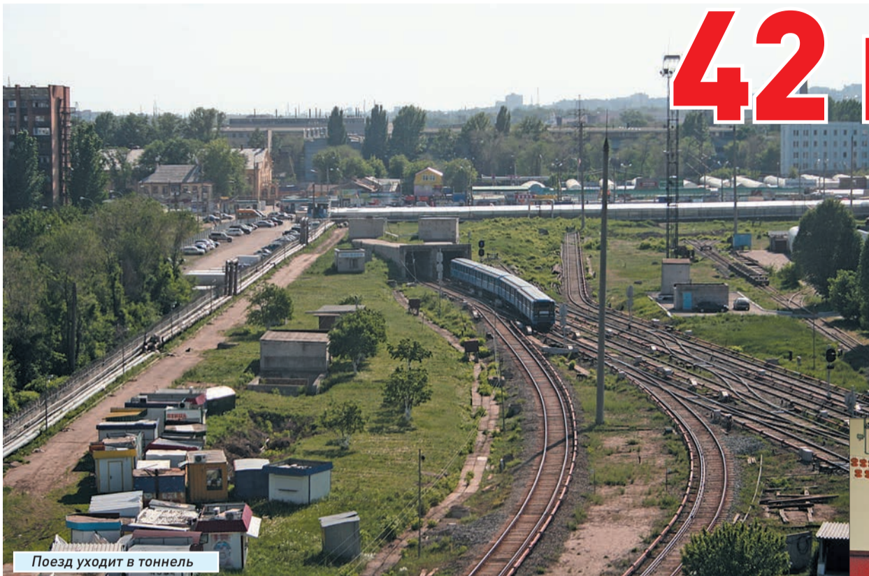
Поезд уходит в тоннель