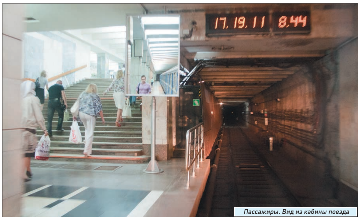
Пассажиры. Вид из кабины поезда