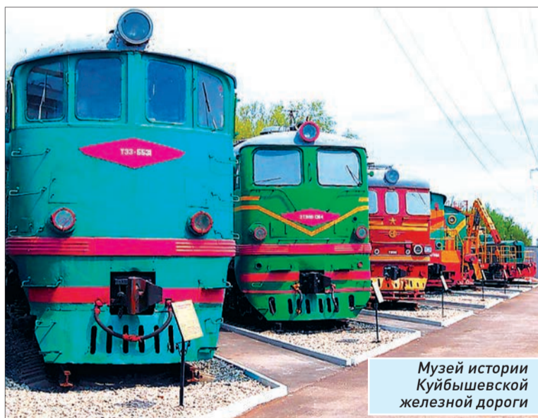
Музей истории Куйбышевской железной дороги

Разумеется, все знают о музее имени Алабина, домах-музеех